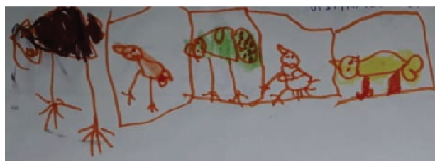
Figura 1. Representación de animales en corrales.

En esos aprendizajes, los pequeños han empleado su capacidad para simbolizar, pero esta capacidad está en pleno progreso; también están desarrollando los rudimentos de los códigos convencionales más frecuentemente utilizados en la escuela (lectura y escritura). Entonces, en el aula de ciencias habrá que potenciar sus aprendizajes privilegiando el uso de los lenguajes y modos de comunicarse en los que ya son hábiles. Esto es, podrán aprender ciencias hablando, escuchando y dibujando. La figura 1 expone el registro de la observación que una niña de cuatro años, de un jardín rural, es capaz de hacer sin emplear el código lingüístico.