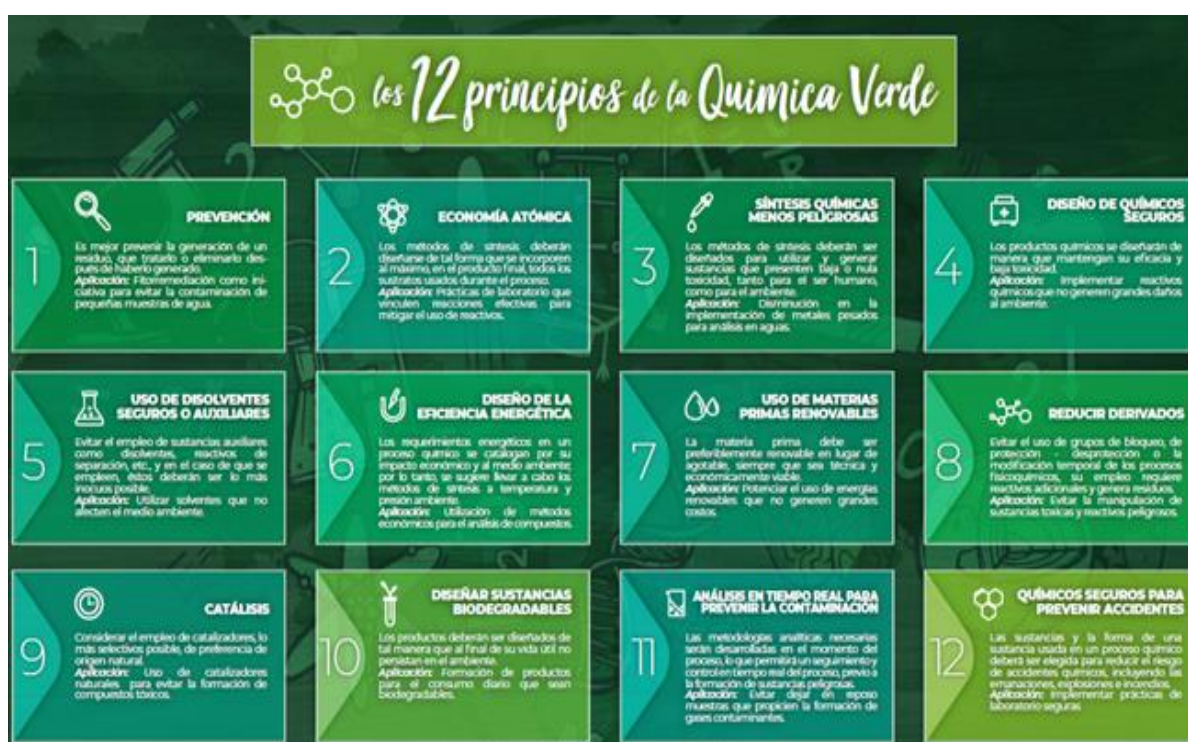
Figura N°1: Los doce principios de la Química Verde por Anastas y Warner (1998). Elaboración propia

De acuerdo con Machado 2011, la Química Verde surge como una respuesta a los problemas ambientales desarrollados por la industria química, haciendo referencia a la mala disposición de los residuos químicos y el desarrollo de nuevos conceptos que involucran: síntesis y economía atómica para dar forma a los 12 principios de la calidad de vida, es decir tiene como finalidad minimizar los impactos ambientales desde el principio del diseño del producto y proceso para fabricarlo.