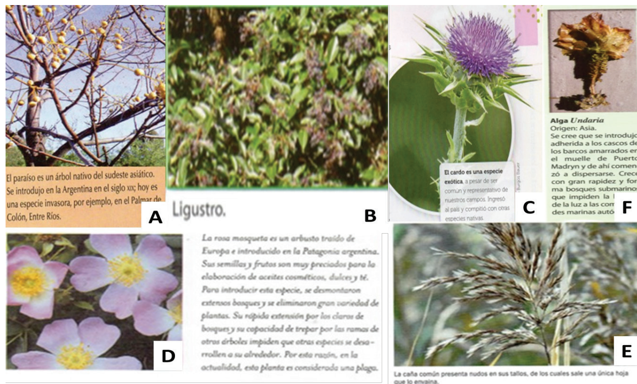
Figura 7. Fotografías con etiquetas verbales de especies exóticas de plantas y alga undaria presentes en los LT. A. paraíso. B. Ligustro. C. Cardo asnal. D. Rosa mosqueta. E. Caña común. F. Alga undaria

cuatro son arbustivas (cardo asnal - Silybum marianum -, ligustro - Ligustrum lucidum -, rosa mosqueta - Rosa rubiginosa - y caña común - Arundo donax -) y no se presentaron ilustraciones de plantas herbáceas. El alga undaria ( Undaria pinnatifida ) solo se presentó en una fotografía en el nivel ESB (figura 7).