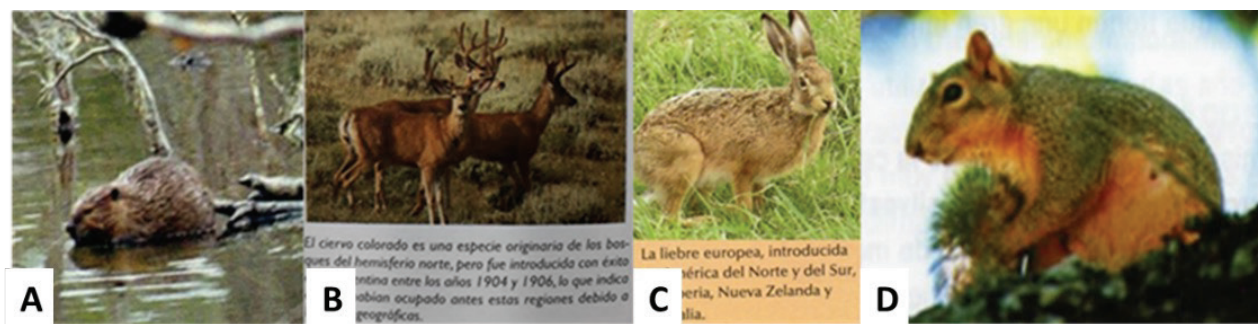
Figura 3. A. Fotografía de un castor presente en ESB . B. Imagen hallada en ESS que muestra a tres ejemplares machos de ciervo colorado. C. Fotografía de liebre europea en un LT de ESB . D. Imagen de la ardilla de vientre rojo hallada en un texto de ESB

pea ( Lepus europaeus ) y la ardilla de vientre rojo ( Callosciurus erythraeus ) (figura 3) (tabla 6); estos resultados concuerdan con los hallados por Campos et al. (en prensa).