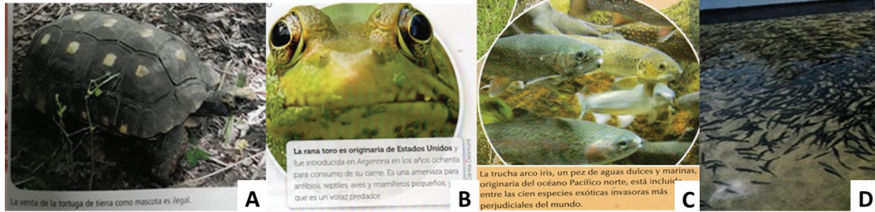
Figura 5. A. Fotografía de la tortuga d66e tierra presente en ESB. C. Imagen de la rana toro de un LT de ESB. C. Fotografía de la trucha arco iris presente en ESB. D. Fotografía que muestra un grupo de peces en un LT de ESS

Por su parte, la inclusión de imágenes correspondientes a los invertebrados (e.g., moluscos y artrópodos) estuvo prácticamente ausente también (tablas 5 y 6). En este sentido, el mejillón dorado ( Limnoperna fortunei ) (figura 6A), molusco invasor de los sistemas de agua dulce del Río de la Plata (Darrigran y Damborenea, 2006), fue ejemplificado en cuatro LT de ESB, sin embargo, solo dos de ellos mostraron fotografías en las que pueden observarse ejemplares con detalles que permitan hacer alguna identificación; tampoco figura una escala que referencie sobre el tamaño de los moluscos. Las fotografías presentan etiquetas verbales que aportan información sobre el lugar de procedencia y el vector, a través del cual se produjo su ingreso al río de La Plata, pero solo una de ellas es de tipo denotativa, es decir, está vinculada con el texto en el que se aborda la temática, aunque no se haga mención a la especie que se ilustra en la fotografía. Otro ejemplo corresponde a la abeja africana ( Apis mellifera scutellata ) (figura 6B); su mención en el libro de texto está acompañada por una fotografía connotativa de un panal, sobre el que se encuentran las abejas, sin etiquetas verbales, de función decorativa.