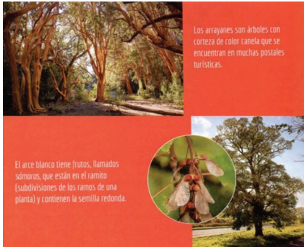
Figura 1. Fotografía doble encontrada en un LT de ESB que muestra plantas de arrayanes y arce

Este último aspecto es de valor educativo ya que la primera fotografía muestra la planta desde una visión amplia; la segunda en cambio, se centra en una parte específica de ella (los frutos). Pozzer y Roth (2003) denominan complementarias a estas fotografías, ya que la segunda imagen pasa a formar parte de la primera, como un detalle de mayor magnitud que proporciona al lector una mejor visualización del fenómeno tratado. Otro ejemplo hallado en ESB, incluye una fotografía doble, en blanco y negro, que corresponde a una especie nativa, el chingolo ( Zonotrichia capensis ) y el gorrión común ( Passer domesticus ) como especie exótica (figura 2A). Si bien la imagen presenta un pie de figura en el que se explicita la capacidad de desplazamiento que posee la forma exótica sobre la nativa, la calidad de las fotografías no permite una buena distinción entre las especies, lo que podría generar dificultades a los estudiantes para su reconocimiento.