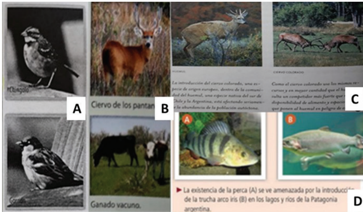
Figura 2. A. Fotografía doble presente en ESB en la que se observan dos especies de aves: el chingolo y el gorrión. B. Imagen que muestra a la especie nativa ciervo de los pantanos y el ganado vacuno. C. Fotografía doble del huemul y el ciervo colorado. D. Imagen doble hallada en un texto de ESS en la cual se muestra a la especie exótica invasora trucha arco iris y la especie nativa (perca).

Este último aspecto es de valor educativo ya que la primera fotografía muestra la planta desde una visión amplia; la segunda en cambio, se centra en una parte específica de ella (los frutos). Pozzer y Roth (2003) denominan complementarias a estas fotografías, ya que la segunda imagen pasa a formar parte de la primera, como un detalle de mayor magnitud que proporciona al lector una mejor visualización del fenómeno tratado. Otro ejemplo hallado en ESB, incluye una fotografía doble, en blanco y negro, que corresponde a una especie nativa, el chingolo ( Zonotrichia capensis ) y el gorrión común ( Passer domesticus ) como especie exótica (figura 2A). Si bien la imagen presenta un pie de figura en el que se explicita la capacidad de desplazamiento que posee la forma exótica sobre la nativa, la calidad de las fotografías no permite una buena distinción entre las especies, lo que podría generar dificultades a los estudiantes para su reconocimiento.