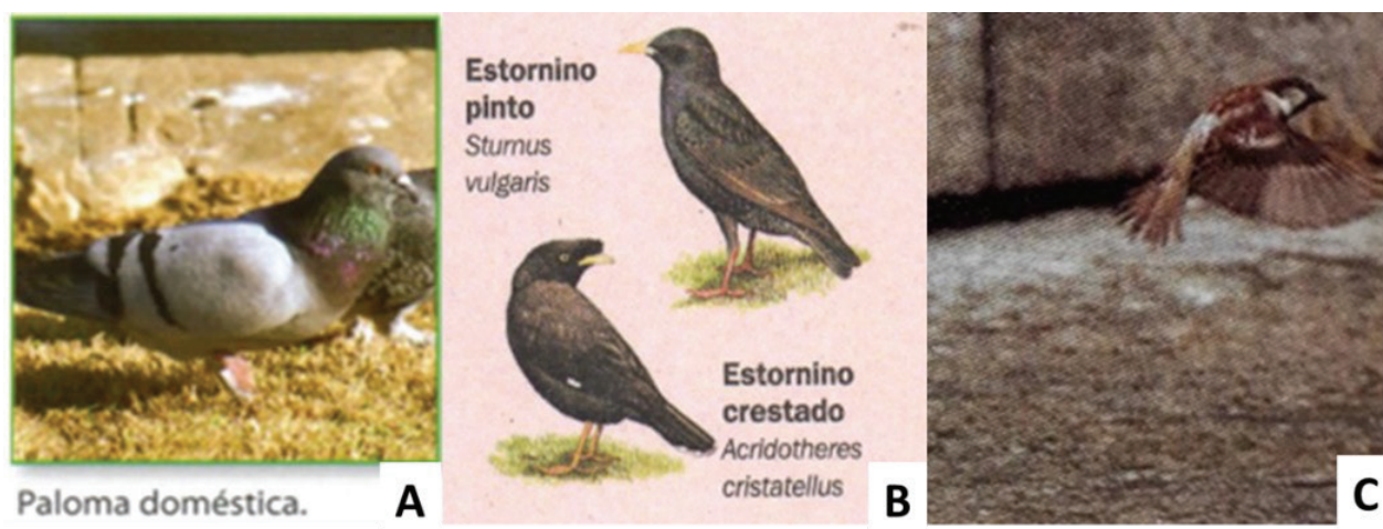
Figura 4. Especies exóticas invasoras halladas en los LT. A. Fotografía de la paloma doméstica presente en ESB. B. Dibujo figurativo de los estorninos hallado en ESS. C. Fotografía del gorrión común en un LT de ESB

Con respecto a las ilustraciones de aves, su presencia fue significativamente baja en los dos grupos (12 % ESB; 11 % ESS) (tabla 5). Las especies incluidas en los LT de ESB fueron el gorrión común ( Passer domesticus ) y la paloma doméstica o casera ( Columba livia ); esta última, junto con los estorninos ( Sturnus vulgaris , Acridotheres cristatellus ), también fueron encontradas en los LT de ESS (figura 4) (tabla 6).