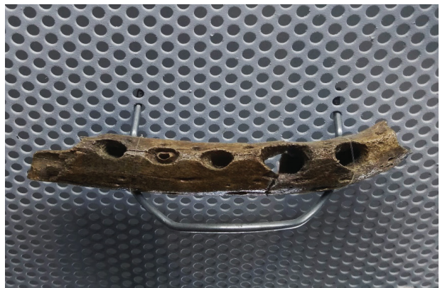
Título: La ocarina

Gryposuchus colombianus (Langston, 1965) es una especie extinta de Gavialoideo que tuvo presencia al norte de Suramérica hace aproximadamente 13 M.a. Algunos de los especímenes colectados se han hallado en el Desierto de la Tatacoa. Sus principales características son la presencia de un cráneo deprimido; un hocico largo y estrecho con un ensanchamiento en la parte anterior, debido a sus alveolos (Langston y Gasparini, 1997); presenta una longitud total de 10 metros aproximadamente. El género Gryposuchus denota una amplia distribución en Suramérica, teniendo presencia en Colombia, Argentina, Perú, Brasil y Venezuela. Este espécimen pertenece a las colecciones del Museo de Historia Natural de la Tatacoa en Villavieja, Huila.