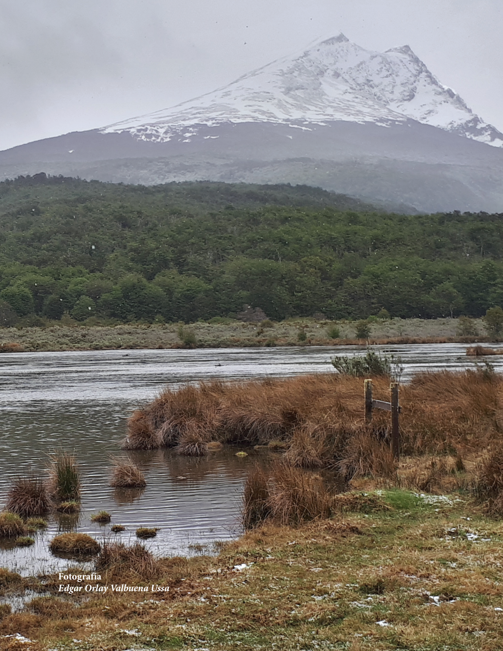
Fotografía Edgar Orlay Valbuena Ussa