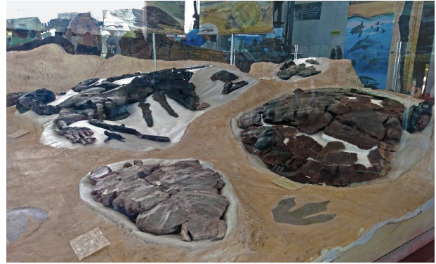
Título: Testudines de Paja