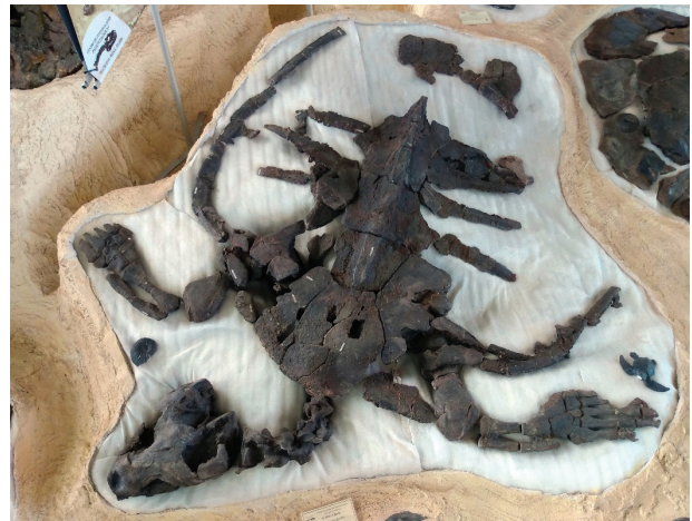
Título: ¿La más antigua?

Se presenta el registro de las dos especies cretácicas halladas y determinadas para la Formación La Paja en Villa de Leyva y sus alrededores en el departamento de Boyacá. En primer lugar, Desmatochelys padillai Cadena y Parham, 2015, posiblemente es la tortuga marina más antigua del mundo (Izquierda); enseguida se aprecia un plastrón con 52 huevos pertenecientes a un segundo espécimen de D. padillai (Cadena et al. , 2018) (En medio); por último, Leyvachelys cipadi (Cadena, 2015), es la especie más antigua descrita hasta la fecha de la familia Sandownidae a nivel mundial.