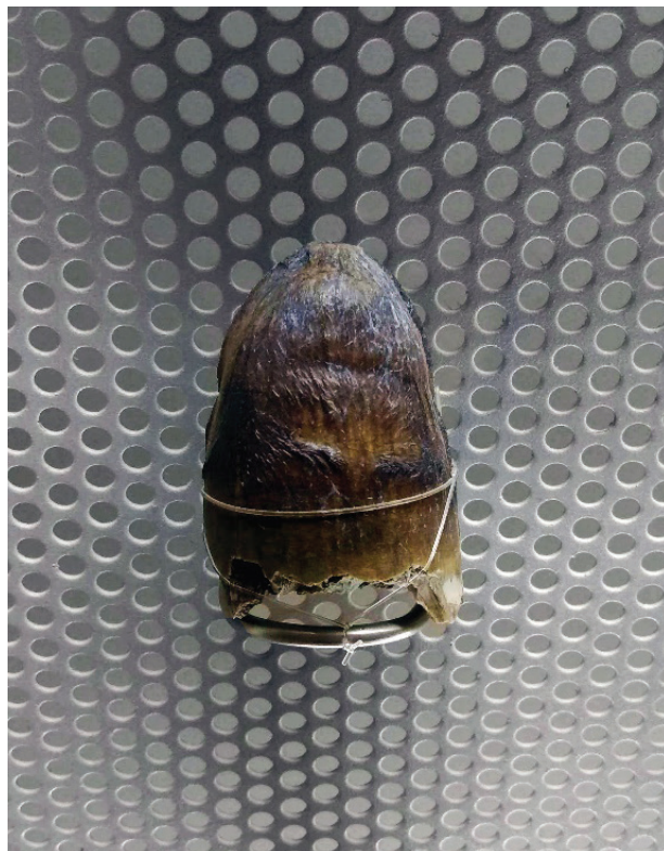
Título: Diente Globoso

neales. Algunos de sus caracteres diagnósticos son: un hocico relativamente largo, con costados rectos y con la parte anterior redondeada; una apertura nasal más larga que ancha y fenestra latero temporal más pequeña que las orbitas (Langston, 1965). Ha sido considerado como uno de los caimanes cenozoicos más grandes hallados hasta el momento con una longitud de 10 metros aproximadamente. Este espécimen reposa en las colecciones del Museo de Historia Natural de la Tatacoa.