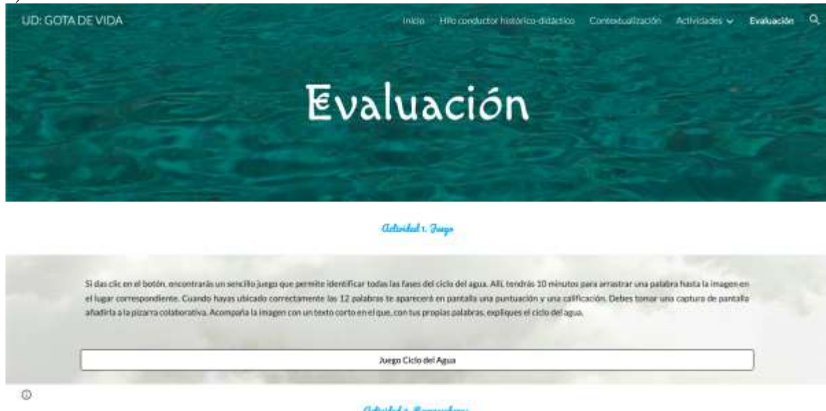
Figura 3. Secuencia Didáctica Elaboración propia