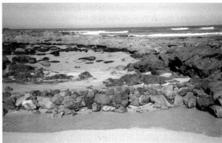
Figura 5. Vestígio da Camboa do Picão, que ficou soterrada durante várias décadas. Fonte: (Freitas, 2004, p. 185).

Em Portugal, há vestígios de antigas camboas, as quais foram desativadas e, em muitos casos, ficaram soterradas por areia depois da proibição de seu uso, vindo a ser descobertas e estudadas (Figura 5) (Freitas, 2004).