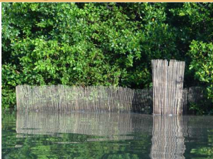
Figura 2. Camboa em área de mangue em Siribinha.

Outros questionamentos podem ser feitos: essa/e técnica/artefato teria surgido por influência indígena tupinambá, africana ou portuguesa, já que grupos dessas três origens habitaram a região no passado? A referência a um padre no conto teria relação com a presença de jesuítas na região, no período colonial (cf. Pereira, 2011), ou se relacionaria com algum outro evento? Todas essas dúvidas reforçam a importância de se conhecer a rede de filiações em que o termo, o artefato e a técnica se inscrevem pode ajudar a dar sentido à narrativa e à realidade local, ampliando horizontes de conservação do patrimônio biocultural.