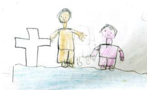
Figura 1. Narrativa de estudante da comunidade de Poças sobre a Camboa do Padre. Fonte: Livro Contos e Encantos do Mangue, Rio e Mar: histórias contadas pelas crianças de Siribinha e Poças, 2018.

Os amigos foram procurar ele, e o acharam. Pegaram uma tarrafa e o cobriram. E tiraram a areia da boca dele.