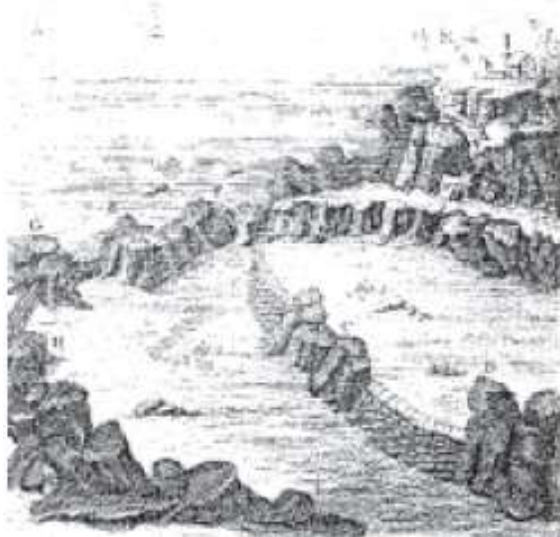
Figura 6. "Curral" primitivo para reter o pescado na maré baixa.