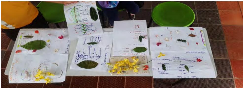
Figura 1. Material lúdico hecho por los estudiantes de primaria

Nota: la especie Cassia fistula se utilizó para ilustrar el concepto de inflorescencia y partes de una flor como: estambre, pistilo, pétalos, sépalos. La especie Jatropha integerrima Jacq para la identificación de flores masculinas (filamento y antera).