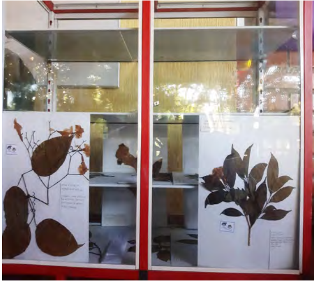
Figura 3. Exhibición de la colecta vegetal