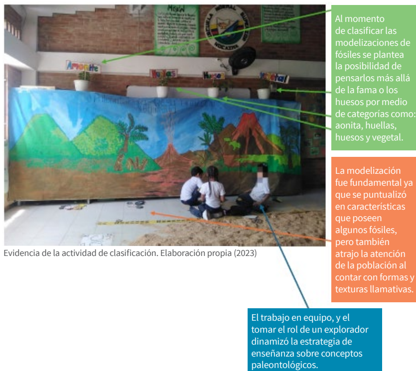
Figura 2. Análisis de un tramo de la Estación de DinoCity.

Específicamente, para esta categoría se hará énfasis en el montaje de la estación. En la figura 2 se resaltan las actividades llevadas a cabo durante la exposición, orientadas a los participantes de NormalCity, y en el enlace Análisis y sistematización de fotos DinoCity.pdf se pueden visualizar otras imágenes de lo acontecido en la estación, con las respectivas observaciones de sistematización.