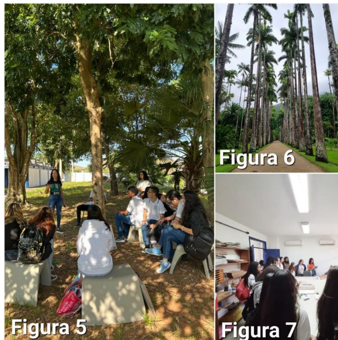
Figura 5. Rueda de conversación sobre pau-brasil; Figura 6. Visita al Jardín Botánico de Río de Janeiro. Figura 7. Visita al laboratorio del jardín botánico

En una rueda de conversación (Figura 5) sobre los conocimientos presentados durante la visita al Jardín Botánico, los estudiantes recordaron información sobre la diversidad de plantas en el exterior del jardín (Figura 6) y la visita al laboratorio de botánica (Figura 7), donde aprendieron sobre el trabajo realizado por investigadores en la elaboración, organización y mantenimiento de colecciones botánicas para la conservación de la diversidad vegetal. El primer grupo buscó información sobre pau-brasil en un libro sobre árboles brasileñas (Lorenzi, 2022) y en sitios web de instituciones en el campo de la conservación de especies botánicas ( https://www.gov.br/jbrj/pt-br ; https://www.icmbio.gov.br/cbc/ ). Los estudiantes mostraron interés y entendieron cómo podían realizar búsquedas por nombre científico o popular, además de observar el color, la forma del tallo y la disposición de las hojas, comparando las fotos del libro con el árbol de la escuela.