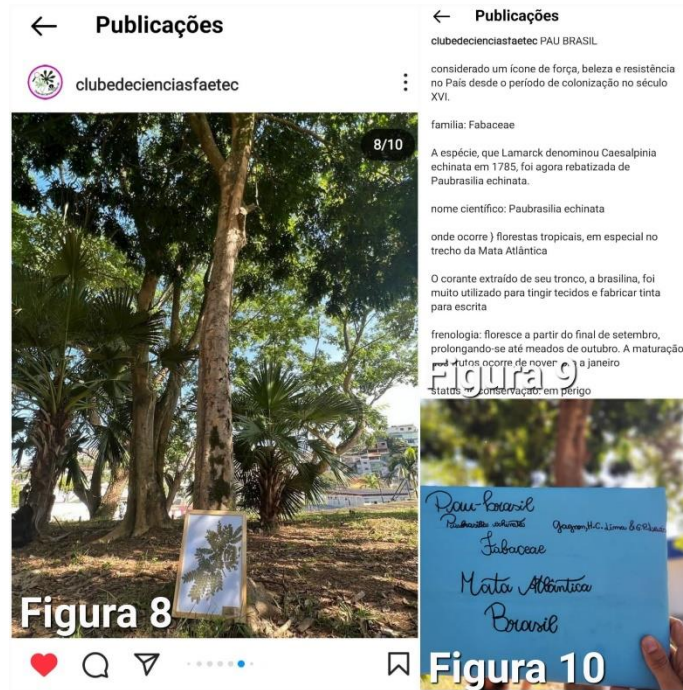
Figuras 8 e 9. Publicación sobre pau-brasil en la red social Instagram del club de ciencias; Figura 10. Placa de identificación producida por los socios del club

Revista Bio-grafía. Escritos sobre la Biología y su enseñanza. Año 2023; Número Extraordinario. pp xx-xx. ISSN 2619-3531.