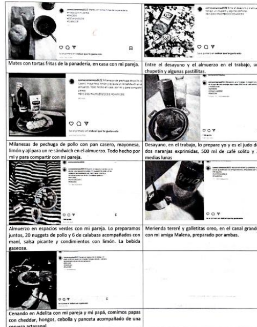
Imagen 2. Ejemplo Perfil alimentario de un estudiante