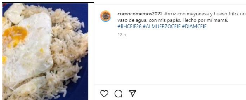
Imagen 1. Unidad de análisis: Imagen comentada

Respecto de la metodología para la producción de PeA y PA, Se produjeron sólo algunas adecuaciones menores al dispositivo ya validado en una investigación previa (Bahamonde, et al, 2021). Un día de la semana y un día de fin de semana, cada estudiante subió a un sitio Instagram (perfilado para la investigación) una imagen comentada de cada episodio alimentario del día, especificada con un #, según se refiriera a desayuno, almuerzo, merienda, cena o picoteo (Imagen 1)