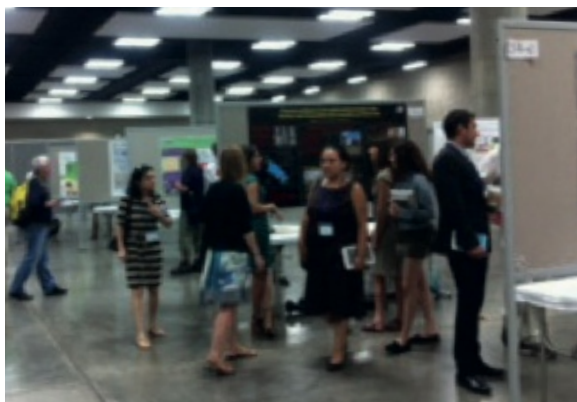
Figura 3. La comunicación de los resultados a la comunidad es una experiencia muy valiosa dentro del proceso de enseñanza-aprendizaje

Existen muchas formas de expresar las ideas y experiencias acumuladas a lo largo del proyecto, por lo que es muy importante que cada uno de los equipos comunique al resto de sus compañeros los resultados de su investigación, intercambien sus ideas y productos obtenidos. De esta forma todos los integrantes del grupo se enriquecerán en conocimientos y experiencias.