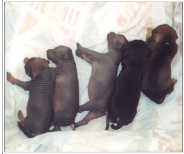
Figura 1. Camada de perros pelones mexicanos.

Desde el punto de vista biológico, siempre ha sido objeto de atención su condición mixta (figura 1), por lo que se conoce con detalle su genética, incluso el gen del cual se derivó su condición de alopecia; su patrón de herencia, que se ajusta maravillosamente a los principios mendelianos; su histología y su ADN, lo cual permite ubicar su posición dentro de la genealogía de los perros.