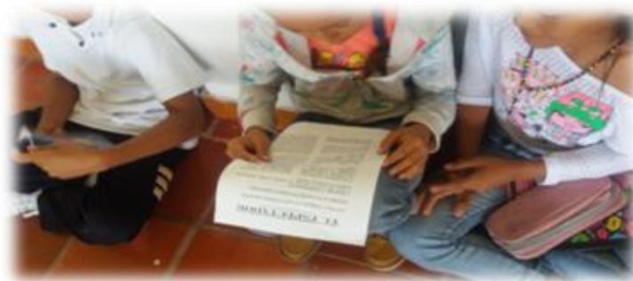
Figura 1. Lectura de la noticia. I.E.D. Novilleros, Caparrapí, Cundinamarca 2017

Al finalizar esta sesión los estudiantes contaron con un tiempo para consultar y profundizar argumentativamente el rol de sus personajes, y además formular las preguntas y respuestas que serían expuestas en la siguiente sesión y las que fueron plasmadas en una cartelera.