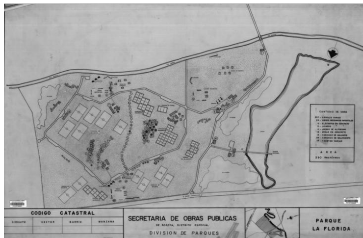
Imagen 2. División del parque La Florida de Bogotá. (Instituto de Desarrollo Urbano, 2016).

La caracterización de los estratos de vegetación, realizó siguiendo la propuesta de Marín & Parra (2015) la cual contempla las siguientes formas de crecimiento de interés para el presente trabajo: