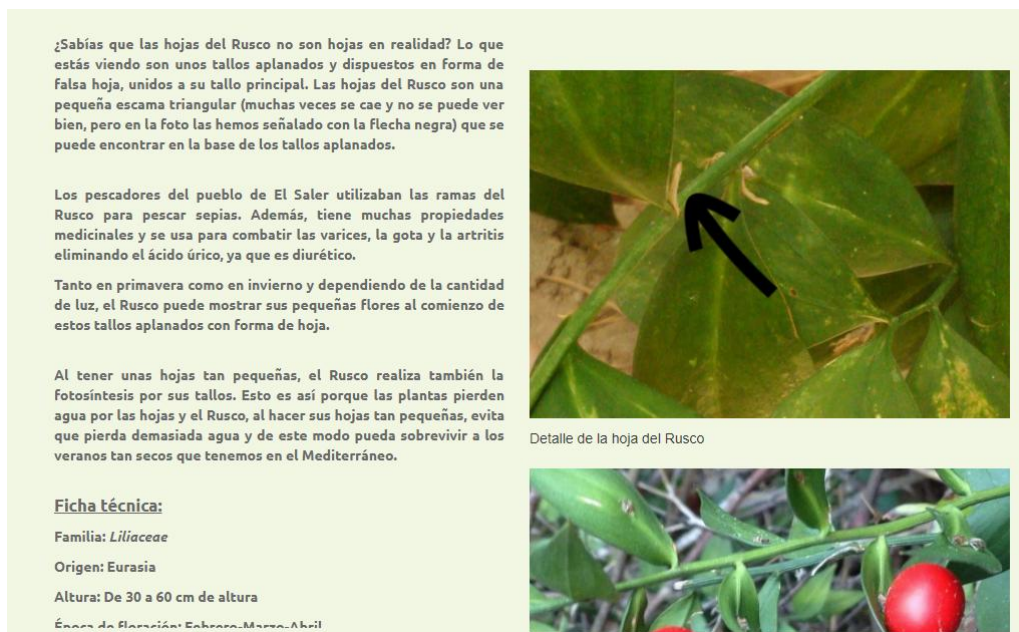
Imagen 2. Ejemplo de ficha virtual de una especie vegetal. Ruscus aculeatus

En el 2016 se seleccionaron 19 especies vegetales diferentes ubicadas en el recinto de la Facultat de Magisteri de la Universitat de València (España). De cada una de estas plantas se creó una ficha virtual alojada en los servidores de la Universitat de València a modo de página web ( www.uv.es/quicknatura ), donde se muestra información sobre ella. Esta información tiene un enfoque inicialmente anecdótico, para ir avanzado hacia una información más compleja, citando desde datos históricos y culturales hasta otros más técnicos y científicos (Imagen 2). De esta manera se generaron diferentes niveles de profundidad de conocimientos, donde el usuario puede elegir hasta qué punto desea llegar. Adicionalmente, todo término botánico utilizado aparece explicado en un glosario específico disponible en todo momento y las fotografías que acompañan a cada ficha muestran detalles de elementos vegetales que pueden no estar presentes durante todo el año.