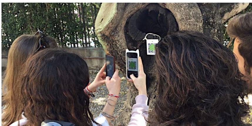
Imagen 6. Alumnos del Instituto de Educación Secundaria Lluís Vives haciendo uso de los códigos QR del proyecto

Varios institutos de la ciudad de Valencia han mostrado su interés en formar parte de la red del proyecto. El Instituto de Educación Secundaria (IES) Lluís Vives ya tiene colocados códigos QR en diferentes plantas de su entorno (Imagen 6) y otros centros educativos han recibido códigos QR de especies vegetales, con su ficha virtual ya creadas, presentes en su entorno para su futura colocación. Por otro lado, otros centros educativos han mostrado interés en contribuir al proyecto, generando su propia información sobre la planta, para alojarla después en Quick Natura.