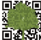
Imagen 1. Logotipo del proyecto Quick Natura

Quick Natura genera a su vez, un vínculo entre diferentes centros educativos y sus respectivas zonas naturales urbanas o periurbanas, a modo de red de intercambio de conocimiento donde los alumnos participan activamente en el desarrollo de los mismos.