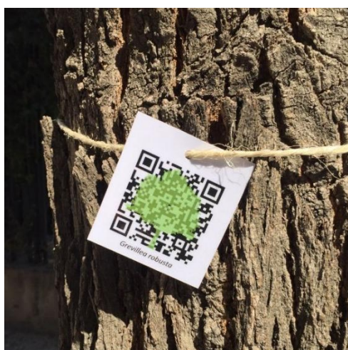
Imagen 3. Código QR del proyecto rodeando el tronco de Grevillea robusta

A su vez, cada ficha virtual posee un cuestionario con diferentes preguntas de tipo lógico-deductivo, según el nivel educativo del usuario, sobre la planta en la que se encuentra. Antes de acceder al cuestionario se ha de seleccionar el nivel educativo, para mostrar las preguntas acordes a dicho nivel. Al contestar las cuestiones planteadas, se recibe al instante información sobre la respuesta. Dichos cuestionarios fueron creados mediante la aplicación Hot Potatoes , siendo por ejemplo: “¿Cómo diferenciarías la Jacaranda de la Albizia si no tienen presentes flores ni frutos? Respuesta: Fijándose en la nerviación de las hojas” “¿A qué se debe que existan olivas negras y verdes en la misma especie ( Olea europaea )? Respuesta: El color dependerá de la maduración del fruto.