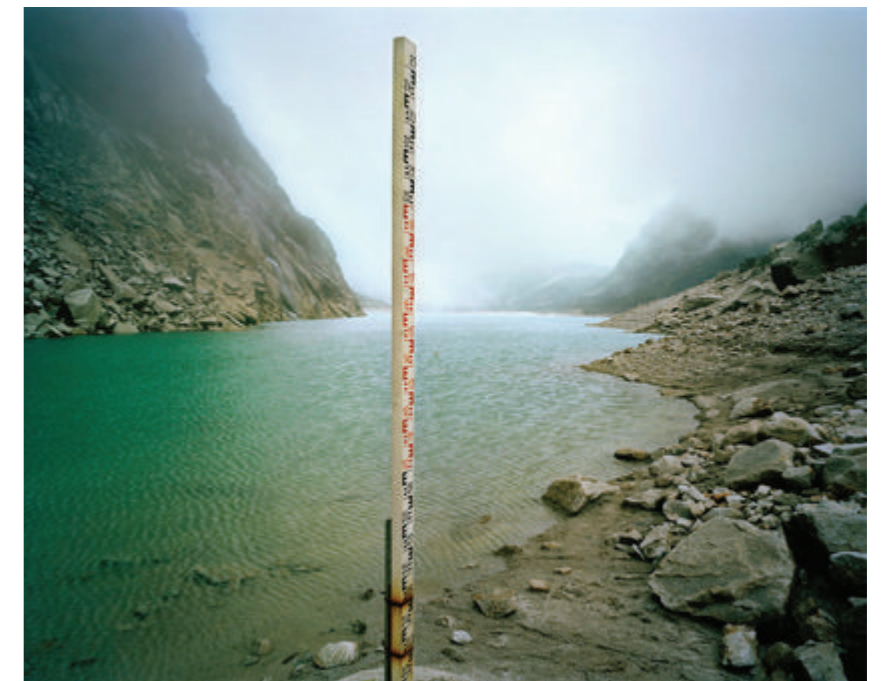
Figura 5. History of the future, Lago Parón, Perú

Con la fotografía como documento pedagógico, desde el 2005 los artistas Susannah Sayler y Edward Morris trabajan con el proyecto History of the future con el cual visualizan diferentes lugares del planeta donde se pueden observar las consecuencias directas del cambio climático y utilizan las imágenes como herramientas pedagógicas para concienciar a la población. El proyecto History of the future no son las imágenes en sí mismas, sino la visualización y distribución de esas imágenes; los artistas en este caso trabajan como educadores y activistas para visibilizar la realidad (véase figura 5).