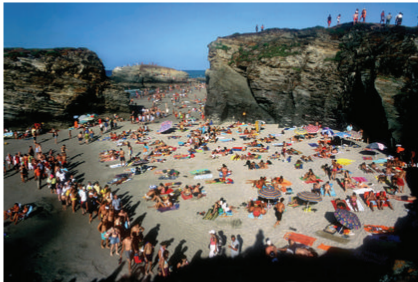
Figura 3. Al Natural_Praias das Catedrais

llega a poner en riesgo los espacios naturales protegidos cercanos a la urbe. Tras un estudio de campo personal sobre la calidad visual y del suelo del PRS, Casulá como fase complementaria se pone en contacto con las comunidades locales para establecer diálogos acerca de su apreciación del entorno y su conexión con el lugar en términos estéticos, intelectuales y emocionales con el fin de reconstruir la memoria colectiva del territorio. Esta actividad continúa al realizarse talleres de fotografía de paisaje como método de expresión personal y experiencia del territorio. Además, Casulá organiza los llamados “Tours con mantel de cuadros” para poner en práctica el concepto del paisaje como territorio percibido y vivido, los cuales consisten en una serie de salidas colectivas para recorrer, experimentar y reflexionar las particularidades del paisaje del Parque Regional del Sureste (Casulá, 2015, pp. 343-361).