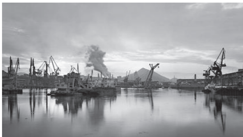
Figura 1. Paisaje sin retorno

Actualmente existe una gran variedad de artistas que trabajan reflexionando sobre los paisajes antropizados y muestran con sus obras cómo consumimos el paisaje, cómo lo transformamos, lo abandonamos y lo asumimos como natural a pesar de su evidente artificialidad. Muchos de los artistas que trabajan sobre la antropización del paisaje lo hacen a través de la fotografía como lenguaje fiel para mostrar los escenarios degradados.