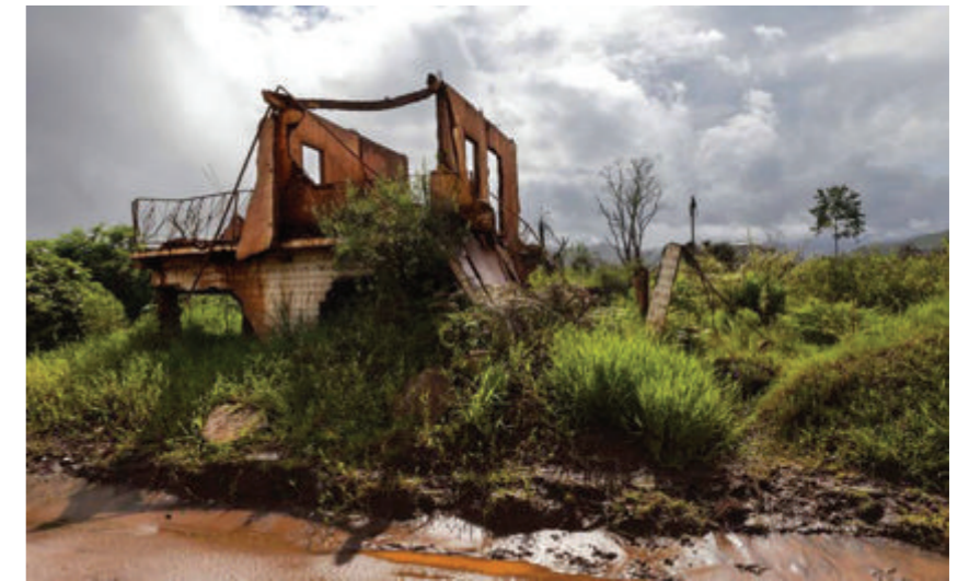
Figura 4. Sin título

Con la fotografía como documento pedagógico, desde el 2005 los artistas Susannah Sayler y Edward Morris trabajan con el proyecto History of the future con el cual visualizan diferentes lugares del planeta donde se pueden observar las consecuencias directas del cambio climático y utilizan las imágenes como herramientas pedagógicas para concienciar a la población. El proyecto History of the future no son las imágenes en sí mismas, sino la visualización y distribución de esas imágenes; los artistas en este caso trabajan como educadores y activistas para visibilizar la realidad (véase figura 5).