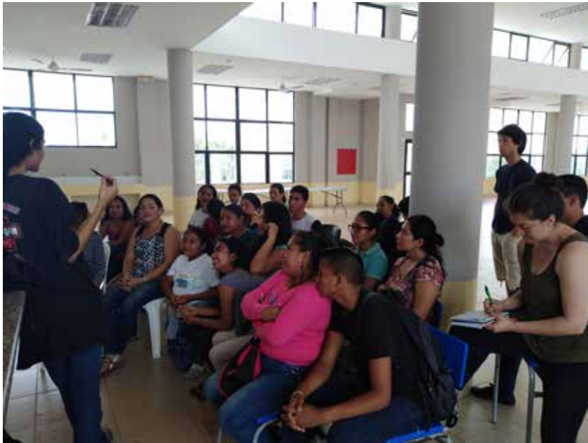
Imagen 8. Reunión con las madres de los jóvenes performers