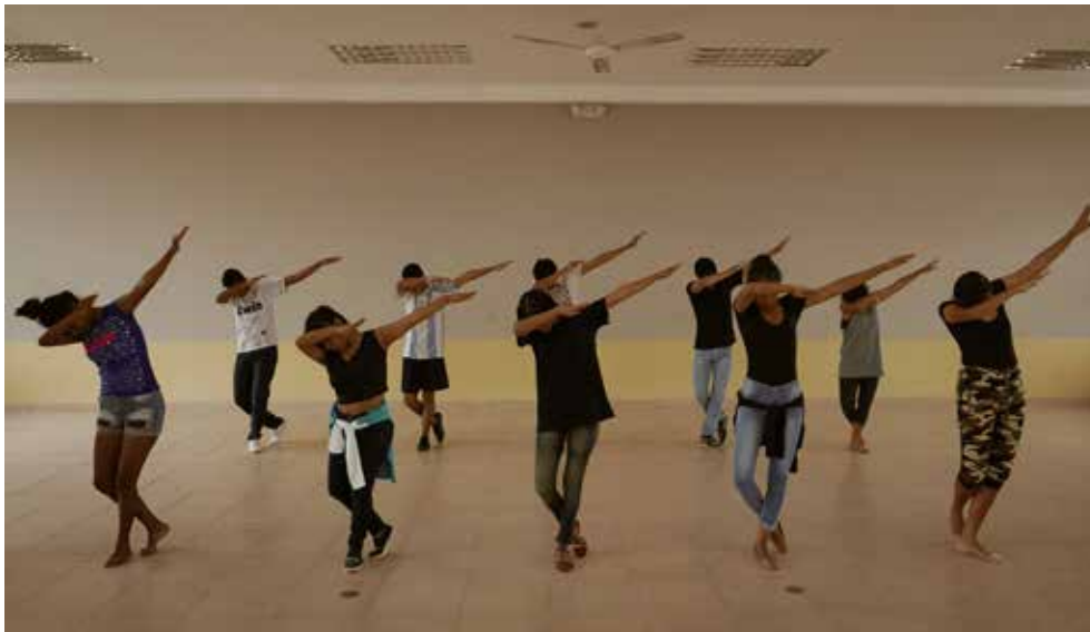
Imagen 3. Puesta en escena de la coreografía. Primera parte

El laboratorio de creación a través del trabajo del cuerpo, el relato y la imagen, configuró un espacio de cruce, de hibridación que hizo posible la presencia de cada joven. Este espacio al ser comprendido como fase liminal, como momento temporal que divide la vivencia y convivencia del joven que pertenece a la institución colegio, causó una transformación de la mirada de quienes estuvieron presentes en ese cronotopo. “La fase liminar fascinaba a Turner porque reconocía en ella una posibilidad del ritual para ser creativo, para abrir el paso a nuevas situaciones, identidades y realidades sociales” (Schechener, 2012, p. 114).