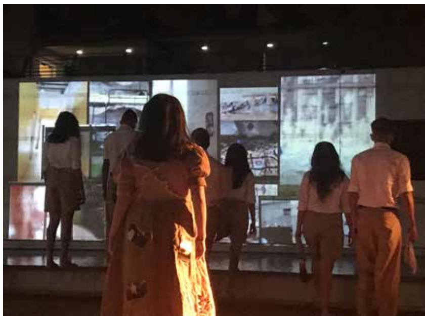
Imagen 6. Foto del estreno de la obra. En primer plano, los cuerpos de los performer. Al fondo, la proyección de las casas

El video, junto con la fotografía sublimada, se convertía en un elemento más que unía lo poético a la vida común, a la intimidad, de tal manera que toda esta acción correspondía al performance del texto de José Luis Pardo, en tanto que cada uno de ellos, cada una de las niñas que intervenían exponía ante públicos diversos el interior de su hogar. Casas humildes producto de la invasión, ahora ocupaban las paredes del MAAC como acto que pretendía configurarse en huella.