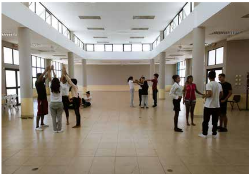
Imagen 2. Creación de partituras de movimiento

restringidas, golpes, deseos de huir, gritos. Acciones, todas ellas, referidas a un emocionar, pero también a un reaccionar sobre su vida, a un mostrar-se como seres frágiles con deseos de ser escuchados, acogidos, respetados, amados.