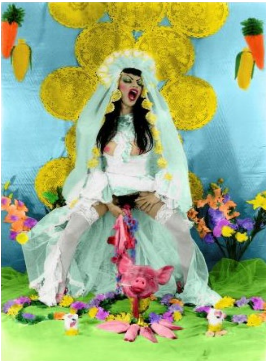
Ilustración 4. “Santa Hija de Perra”. Fotografía de Zaida González (2008).

La mirada del monstruo es un elemento icónico fundamental porque remite a la interioridad del deseo, a la potencialidad del sentimiento, lo que sugiere un propósito o una intencionalidad tras ella (Moraña, 2017, p. 22). La particularidad de la mirada crítica y amenazante de HDP se apoya en sus enormes cejas. La grotesca desmesura de sus cejas perturba y fascina, creando un campo de fuerza que protege y proyecta, que demuestra a la vez el poder y la vulnerabilidad del ser desplazado, del monstruo Hija de Perra.