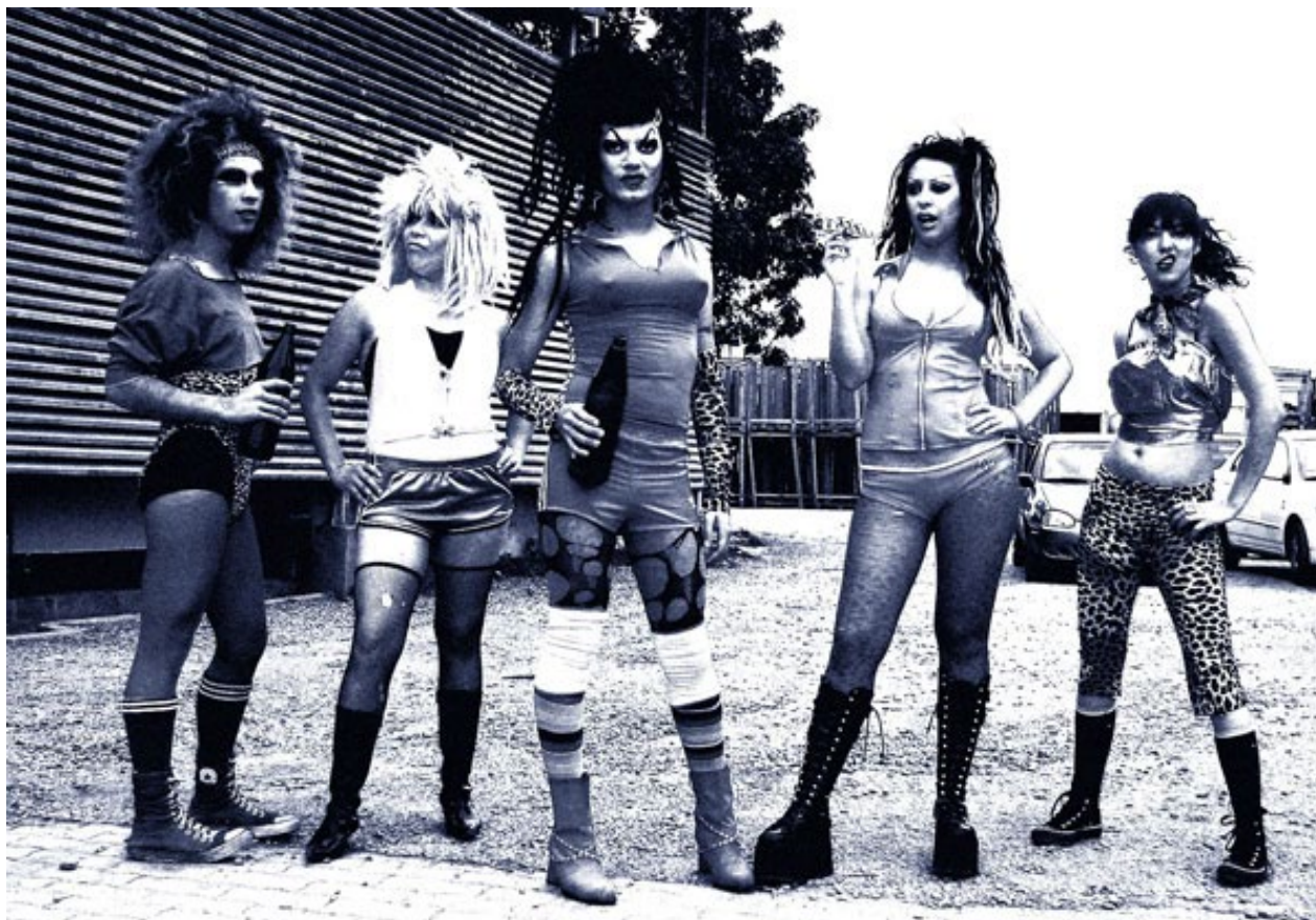
Figura 5. Fotograma del largometraje Empaná de pino .