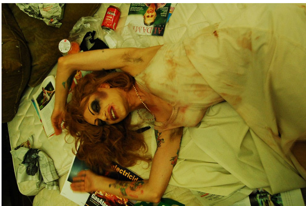
Ilustración 3. Fotografía del largometraje Tetoterapia, el musical . Detrás de las cámaras.