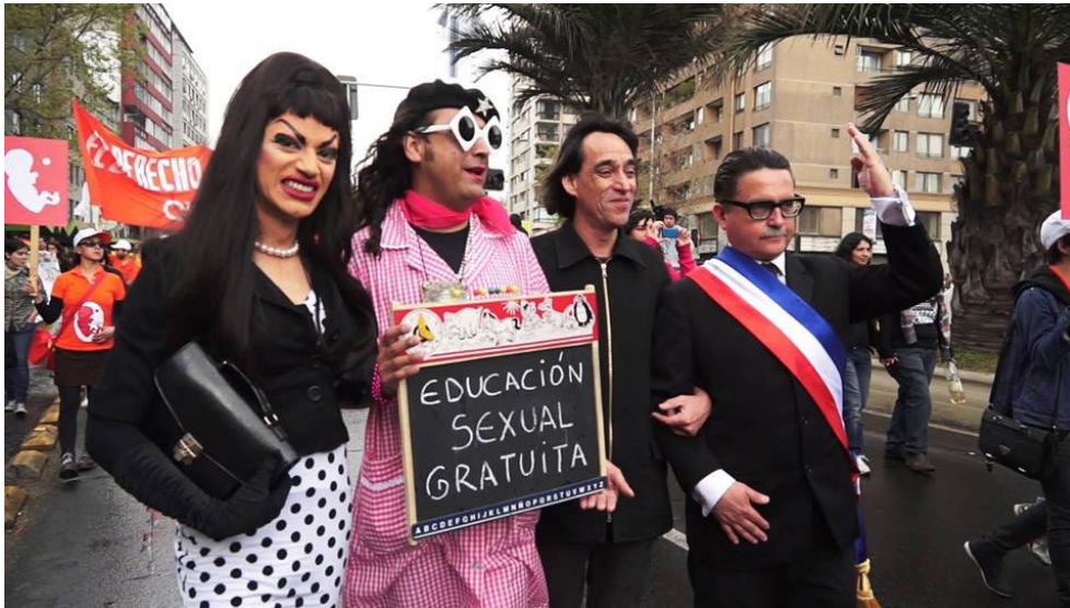
Ilustración 6. Marcha por el derecho al aborto libre.