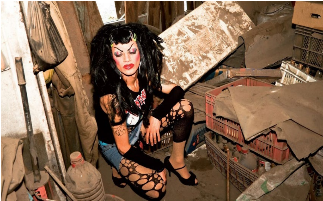
Ilustración 1. Hija de Perra en “El glamour de la basura”. Fotografía de Lorena Ormeño (2009).

El exceso y magnífico derroche de asquerosidades y lujuria presente en los Espectáculos Inmundos 2 son una incitación sensual de lo repugnante, una invitación sucia e inmoral al jubileo del placer y el goce ardiente, una tentación que provoca una tensión constante entre asco y fascinación manteniendo al espectador angustiado en la alternativa del deseo y de la náusea, la atracción y el rechazo, algo que a la vez nos empuja y nos expulsa ante tal revelación de la exuberancia de la vida.