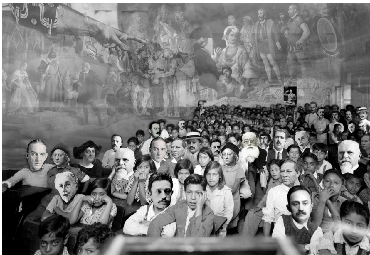
Ilustración 4. Mestizando “indios” a su imagen y semejanza (2023) [Collage digital].

Igualmente, la nueva experiencia de retroalimentación con los participantes del taller trajo consigo una nueva exploración creativa, esta vez en forma de collage bidimensional, aprovechando que desde muy temprano en el proceso me apropié de archivo fotográfico retratando a José Vasconcelos y a la Secretaría de Educación Pública. Las primeras exploraciones creativas se dieron integrando el archivo en la elaboración de los cortometrajes de apropiación. Posteriormente, después de año y medio de trabajo (audio)visual y de mi participación en la primera edición del taller, elaboré Mestizando “indios” a su imagen y semejanza ( collage digital, 2021). Me apropié de una fotografía en blanco y negro tomada en años posteriores a la Revolución mexicana: un salón de clases repleto de infantes. Sustituí un conjunto de sus rostros con los de José Vasconcelos, Cristóbal Colón, Hernán Cortés, Benito Juárez y Joseph Arthur de Gobineau, además de agregar una fotografía de Adolf Hitler al fondo del salón.