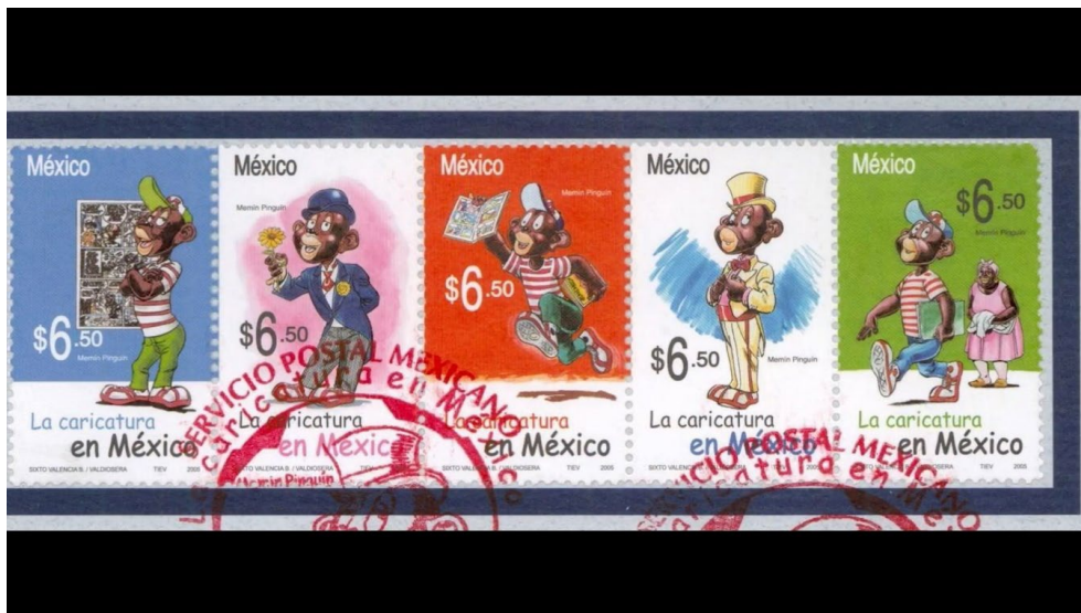
Ilustración 2. Fotograma de Racismo anti“negro” a la Vasconcelos (2022)