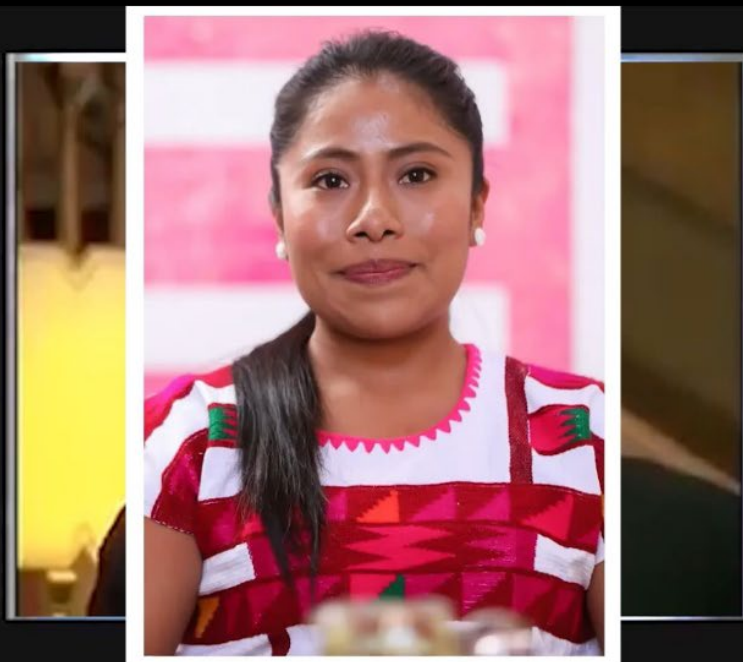
Ilustración 1. Fotograma de Racismo anti“indio” a la Vasconcelos (2022) [Cortometraje de apropiación].

De inicio, tenía claro el tema que deseaba abordar, pero no la forma exacta en la que deseaba hacerlo, por ello, en mi bitácora, a lo largo de 2 años y 9 meses, de julio del 2020 a marzo del 2023, documenté 20 de registros de diferentes propuestas de acción creativa, 16 etiquetadas como “cortometraje”, 1 como “videoarte antirracista”, 2 como “instalación audiovisual” y 1 como “serie transmedia”. De esos 20 registros, 13 surgieron de exploraciones creativas desde la mesa de montaje audiovisual, de procesos de experimentación apropiándome y resignificando materiales, ensayos de ideas y prácticas desde la desarticulación de obras de terceros para rearticular fragmentos en torno a un discurso propio. Los siete registros restantes son exploraciones creativas como esbozo escrito de obras audiovisuales posibles, ensayos de ideas y prácticas narrativas desde la escritura de guion, como sinopsis breves o descripciones más amplias en tres actos. De todas esas ideas desarrollé tres, abordando la reproducción del racismo anti“indio”, el racismo anti“negro” y el aprecio por la blancura cultural y física. Así, un año después de iniciar mis registros en la bitácora, en julio del 2021, concluí una primera etapa del proceso de investigación con una serie de tres cortometrajes de apropiación.