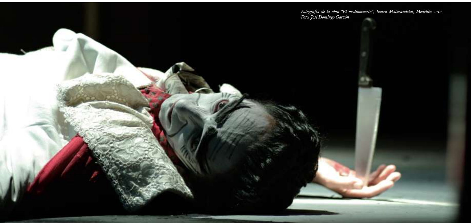
Fotografía de la obra "El mediuuerto", Teatro Matacandelas, Medellín 2010.

De la tiranía del sentido que procuraba el autor, se pasó a la tiranía del signo que procuraba el director, acabados los relatos, la dramaturgia se amplía al accionista y al público emancipado, es decir, ya no solo hay dramaturgia de autor y director, la dramaturgia, esto es, la construcción de sentido y pensamiento también son oportunidades del actor y del espectador. Si en el escenario ya no se cuenta una historia completa, y el actor hace el viaje dentro de sí mismo para el juego de la creación, el espectador también tiene la oportunidad