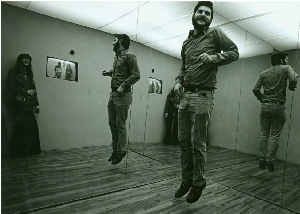
Figura 4. Time Delay Room , 1974, video instalación de Dan Graham

por la ubicación, hora del día, condiciones meteorológicas, luz solar, tráfico y la presencia de personas y árboles, lo que alteraba la percepción individual de cada espectador.