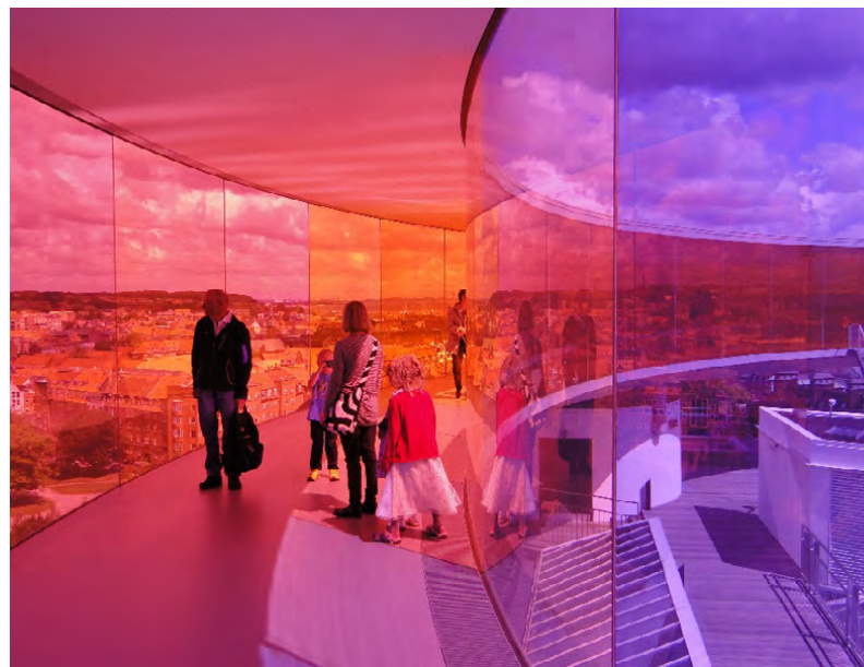
Figura 7. Your Rainbow Panorama , Olafur Eliasson, 2011, Aarhus Kunstmuseum, Dinamarca

Merleau-Ponty critica la perspectiva empirista de la percepción, sosteniendo que las sensaciones no son solo datos sensoriales pasivos, sino componentes activos que se entrelazan a través del juicio cognitivo. Argumenta que “el análisis está dominado por la noción empirista, aunque sólo se reciba como alimento de la conciencia y sólo sirva para manifestar un poder vinculante del que es lo contrario. El intelectualismo surge de la refutación del empirismo, y el juicio tiene a menudo la función de anular la posible dispersión de las sensaciones” (1945, p. 40).