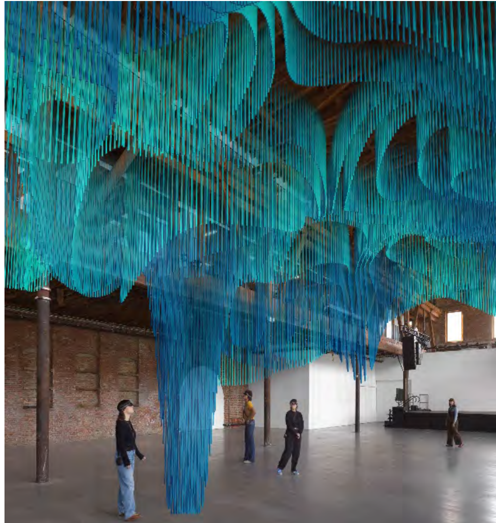
Figura 5. Medusa , estudio Tin Drum en colaboración con el arquitecto Sou Fujimoto, 2021. [Render Digital]

Esta arquitectura virtual no puede proporcionar refugio real. Pero, por otro lado, la naturaleza virtual de la estructura también significa que está liberada de cualquier obligación de adherirse a las leyes de la gravedad o de sostenerse físicamente a sí misma. 1 (Chicco, 2022, párrafo 4)