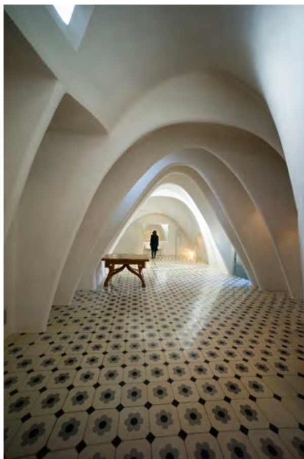
Figura 1. Casa Batlló, Antoni Gaudí (1904-1906), pasillo

El planteamiento de Habermas señala cómo, mediante esta búsqueda consciente de expresiones artísticas liberadas de la actividad cotidiana, se comenzó a transformar la manera en que el artista mostraba sus inquietudes. Este cambio permitió a los espectadores interactuar con el arte de una manera diferente, desplazando la percepción tradicional del arte como un objeto que, a menudo, buscaba representar la realidad, hacia una experiencia más inmersiva y subjetiva.