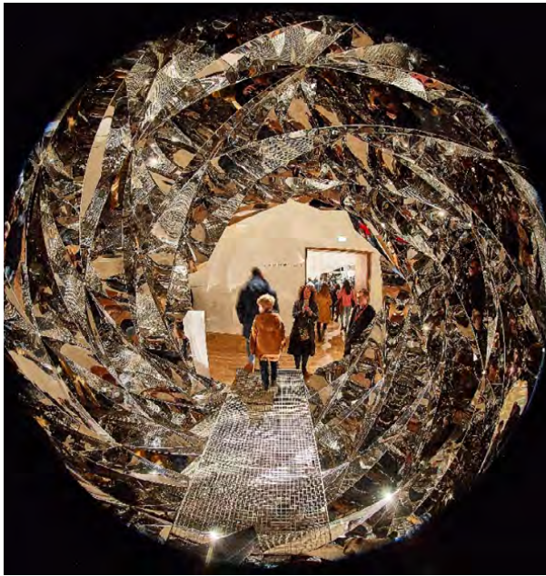
Figura 6. Your spiral view , Olafur Eliasson, 2002