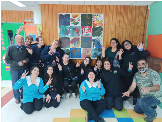
Figura 4. Festejo de la comunidad educativa por la instalación del Mural Colectivo. Sala Cuna y Jardín Infantil “Pequeñitos UdeC”.