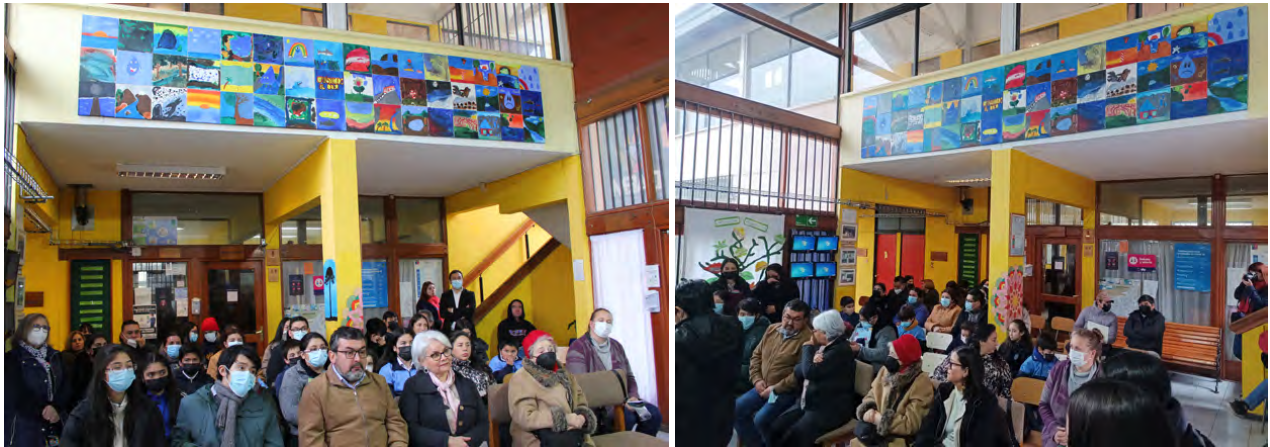
Figura 5. Ceremonia de inauguración y reconocimientos del estudiantado de la escuela rural La Quebrada.