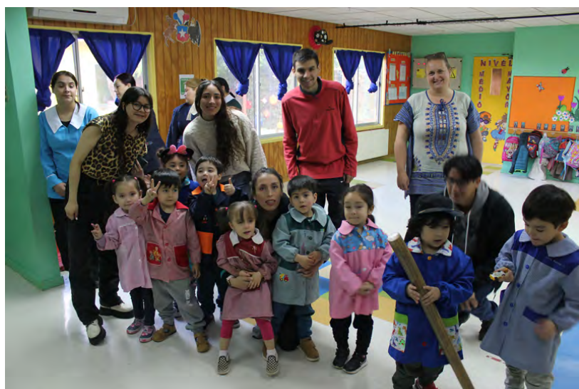
Figura 2. Sesión motivacional sobre el cuidado de los recursos hídricos y resultado preliminar de los talleres de pintura infantil. Niñas y niños de la sala cuna y jardín infantil Pequeñitos UdeC.