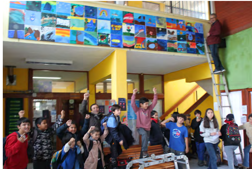
Figura 3. Festejo de la comunidad educativa por la instalación del Mural Colectivo. Escuela rural La Quebrada.