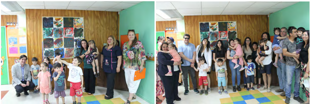
Figura 6. Ceremonia de inauguración del mural en el hall principal de recreación, en la sala cuna y jardín infantil Pequeñitos UdeC.