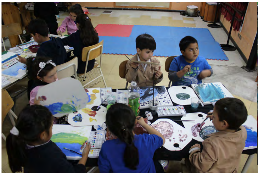
Figura 1. Sesión motivacional sobre el cuidado de los recursos hídricos y resultado preliminar de los talleres de pintura infantil. Estudiantes escuela La Quebrada.