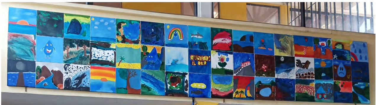
Figura 7. Visualización del Mural Colectivo de Pintura Infantil, instalado en la pared superior del hall de entrada de la escuela rural La Quebrada. Técnica: pintura acrílica sobre 48 telas de 30 x 30 cm. Dimensiones: 90 cm. (alto) x 480 cm. (largo).