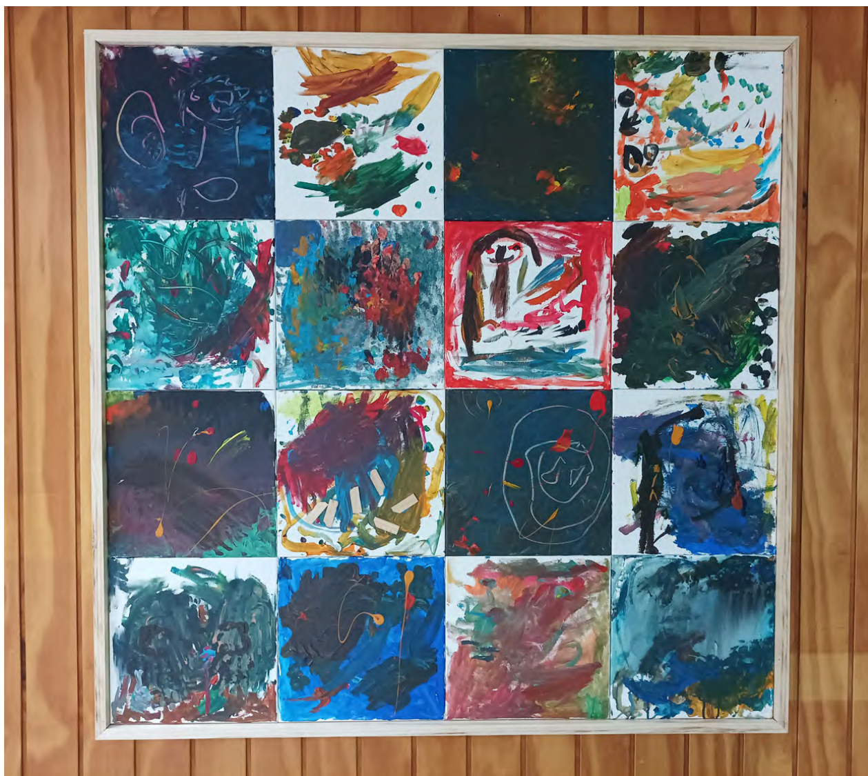
Figura 8. Visualización del Mural Colectivo de Pintura Infantil, instalado en la pared frontal del hall central de recreación y esparcimiento de la sala cuna y jardín infantil Pequeñitos UdeC. Técnica: pintura acrílica sobre 16 telas de 30 x 30 cm. Dimensiones: 120 cm. (alto) x 120 cm. (largo).