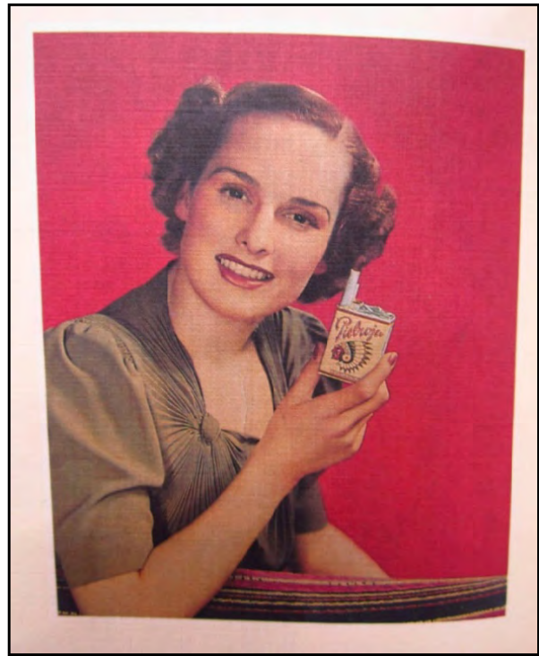
Figura 7. Publicidad de cigarrillos Pielroja. Modelo femenina no identificada