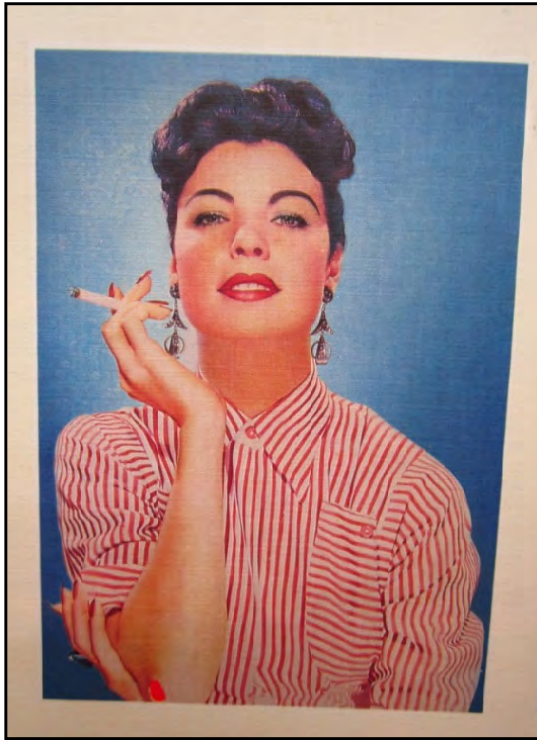
Figura 6. Publicidad de cigarrillos Pielroja. Modelo femenina no identificada