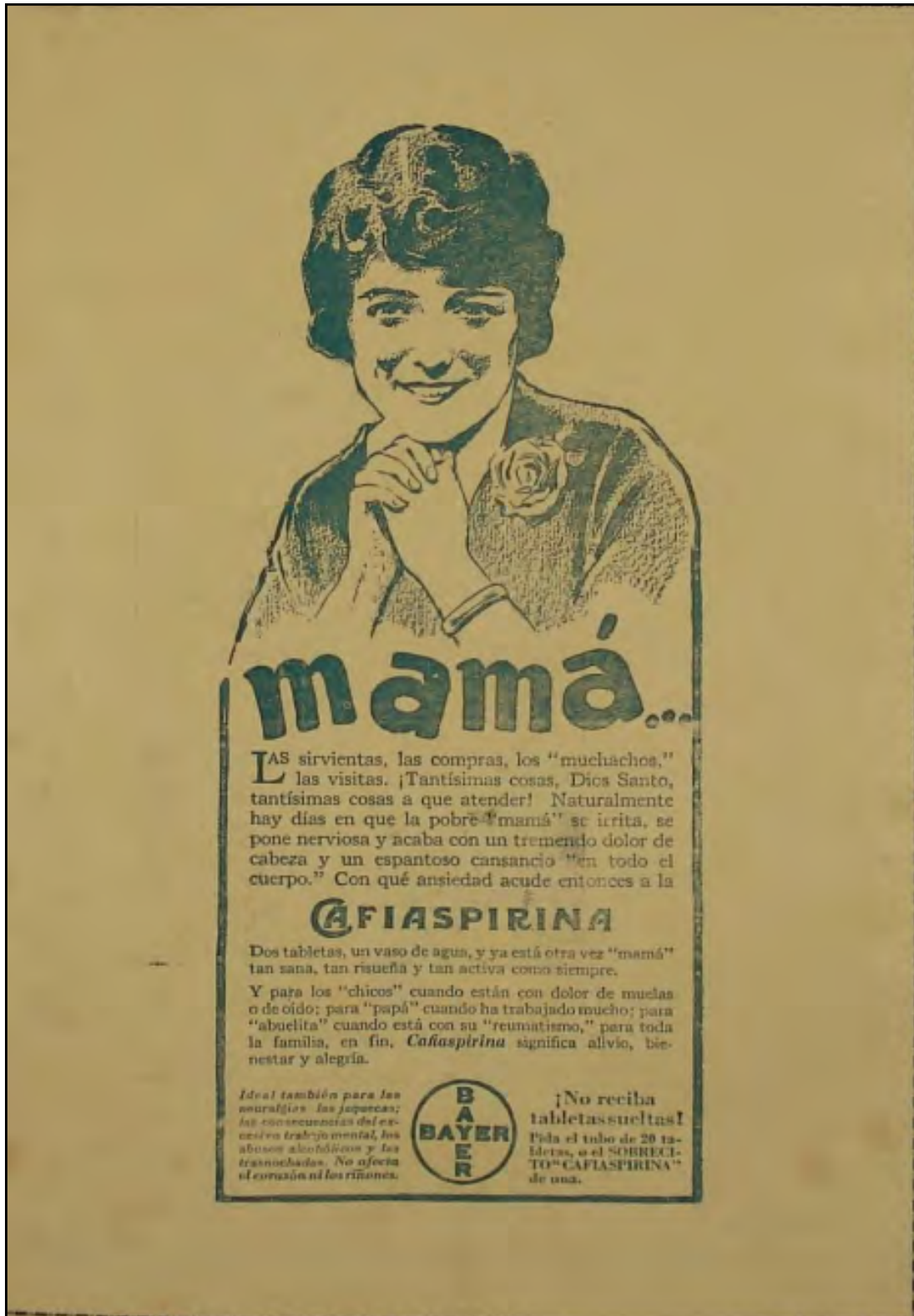
Figura 2. Publicidad de la revista Letras y Encajes (1924)