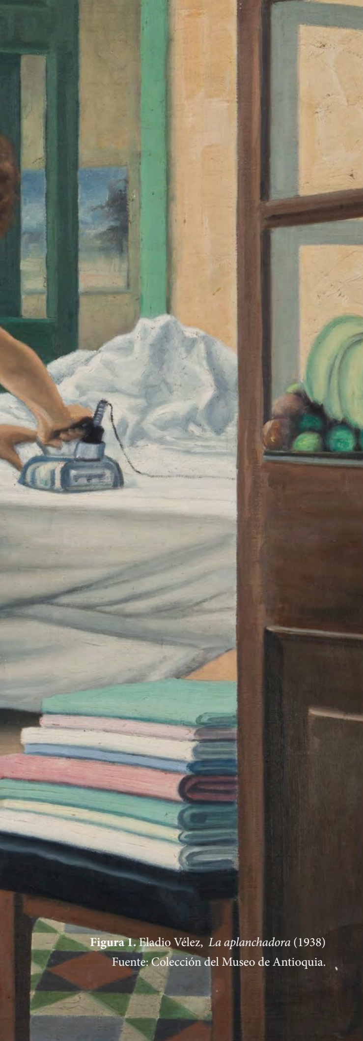
Figura 1. Eladio Vélez, La aplanchadora (1938)