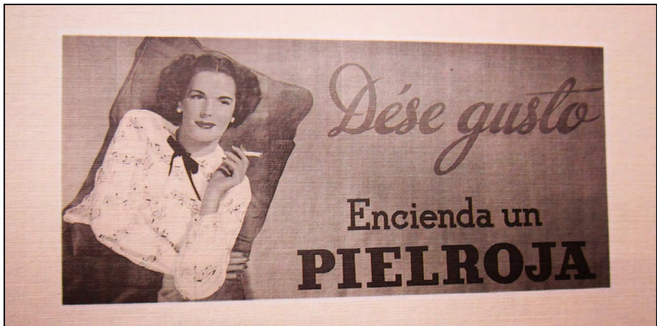
Figura 8. Publicidad de cigarrillos Pielroja. Modelo femenina no identificada