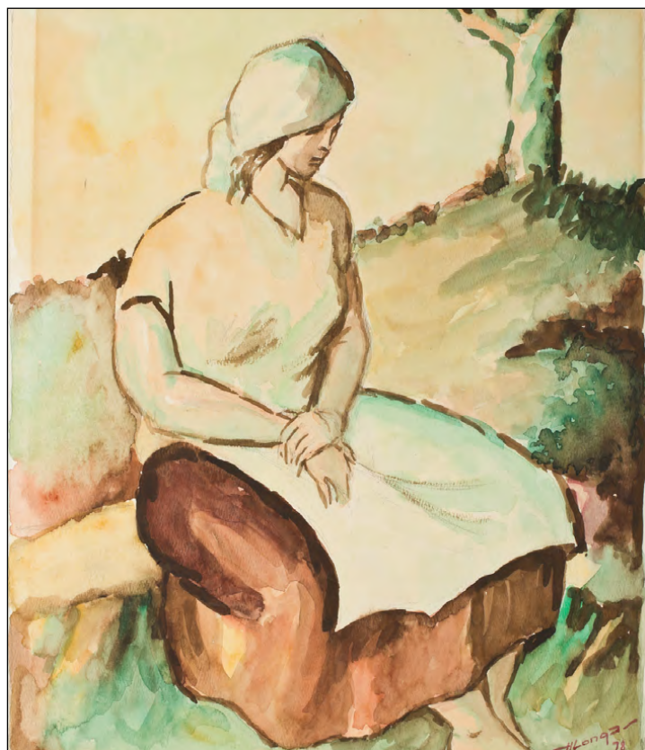
Figura 5. Horacio Longas, La campesina , 1978