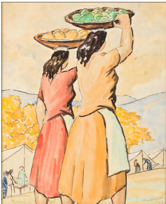
Figura 5. Horacio Longas, Las lavanderas (1978)