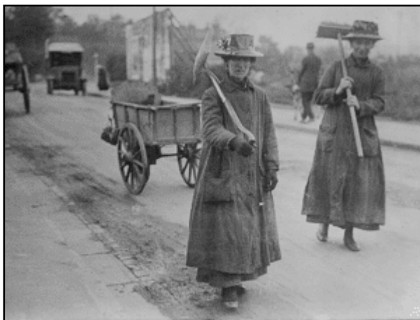
Figura 1. Women workers, England, 22 de octubre de 1917. Fotografía