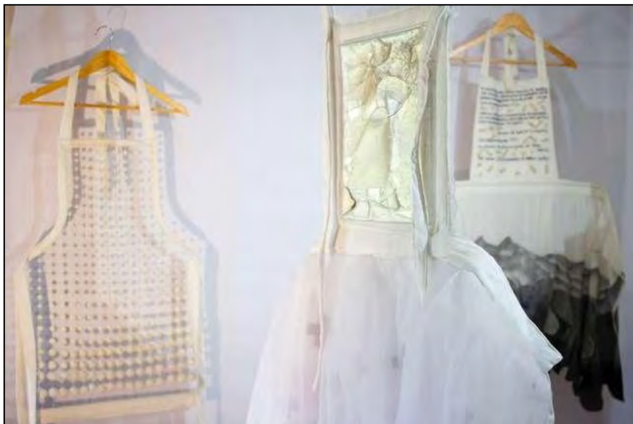
Figura 8. Mantil (2021). Instalación. Cuatro delantales en tela intervenidos con bolas de jabón, dibujo sobre papel y vajillas rotas, resina poliéster (4 m 2 )