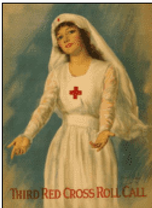
Figura 4. Third Red Cross roll call / Haskell Coffin. Estados Unidos, 1919. Fotografía

Fuente: Library of Congress. Coffin (1919).