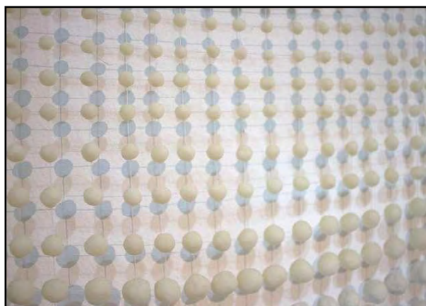
Figura 7. Mantil (2021). Instalación. Delantal en bolas de jabón, hilo, tela y metal (detalle, 55 cm x 110 cm)

Lo que motivó el interés por las implicaciones simbólicas del delantal en el contexto femenino, y por cómo estas han conquistado la esfera laboral en la sociedad, fue el hecho de haber aprendido a coser y tejer crochet en una escuela femenina, en la cual coser era parte de los aprendizajes obligatorios asociados a las manualidades y a las celebraciones anuales del Día de la Madre, a quienes se obsequiaban bordados, agarraderas para ollas y delantales de uso doméstico.