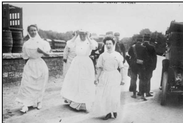
Figura 3. French Red Cross nurses , ca. 1914-1915. Fotografía