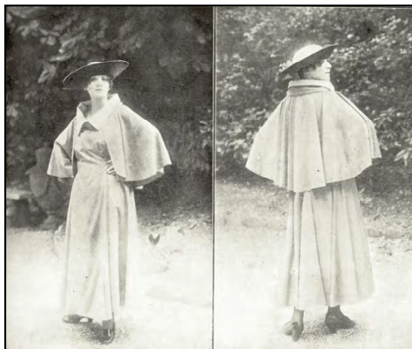
Figura 6. Gran Mantou, burella mastic . Creación de la casa Drecoll, de París. Fotografía

Fuente: Valencia y Arboleda (1916, p. 86).