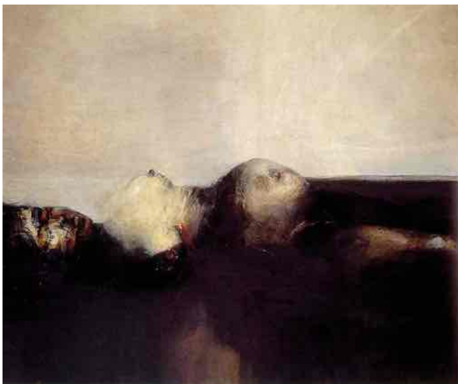
Alejandro Obregón. Violencia (1962) Biblioteca virtual, Biblioteca Luis Angel Arango