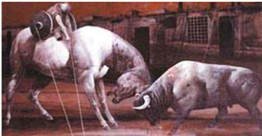
Ilustración 5. Toro jugando, por David Manzur

También debemos recordar que aun cuando las élites han buscado ignorar las lógicas de la violencia en el arte, no por ello han desarrollado una alternativa a ella, por el contrario, muchas veces la pretendida sofisticación del arte burgués colombiano trae implícita la violencia idiosincrática propia de la historicidad del país. De esta manera, espectáculos como la tauromaquia, que recoge en sí mismo el argumento de la muerte y el cadáver —ya definido como omnipresente en la tradición colombiana— es una temática recurrente en la pintura sof que se produce.