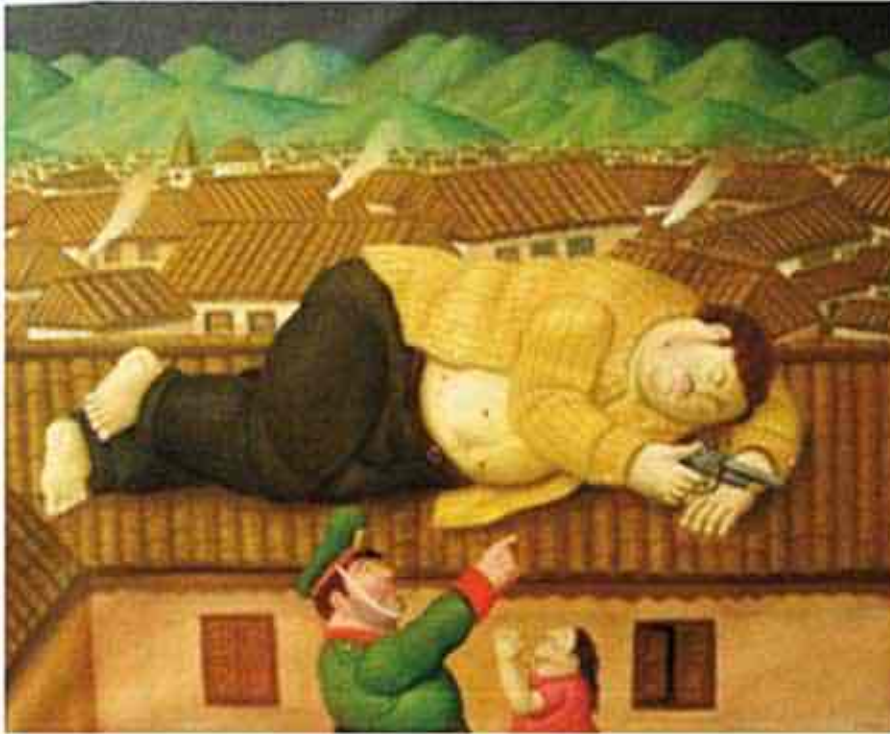
Ilustración 4. La Muerte de Escobar, por Fernando Botero

Uno termina por comprender que en Colombia la violencia en el arte está presente de forma nominal o taxativa. Por tanto, en la época de los grandes carteles de la droga tuvimos un repunte del mercado del arte debido a la cosificación de este, cuando el objeto desplaza al percepto y la obra de arte pierde su aura para transformarse en objeto suntuario. Ocurre entonces que para la penúltima década del siglo XX las élites del país que pretenden un arte ajeno a toda manifestación violenta terminan traficando con obras, comprándose las a un jefe paramilitar; a su vez, críticos de arte son contratados por los grandes capos para que les señalen a dedo qué obra comprar en los catálogos de prestigiosas galerías del mundo. Paradójicamente las grandes sumas de dinero que propiciaron la configuración de esta valoración esnobista del arte fueron las mismas que condujeron a fortalecer la violencia que tanto se quería ignorar, y más aún, dieron mucho material de inspiración al arte crítico. Este, al mismo tiempo, reforzó la filiación con la muerte del devenir histórico del pueblo colombiano, basta ver la figura del cadáver de Pablo Escobar retratada por Fernando Botero como ícono de la lucha armada del y contra el narcotráfico.