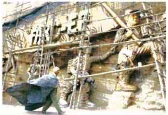
Ilustración 8 Mural de Manuel Marulanda en San Vicente del Caguán, autor anónimo, fotografía del artículo Diez años del Caguán Revista Semana: http://www.semana.com/nacion/articulo/diez-anos-del-caguan/253639-3

En conclusión, gran parte del arte colombiano se ha centrado en una representación figurativa de la violencia, por cuanto esta, históricamente imperante, ha terminado por ser naturalizada, haciéndose un hecho casi inseparable de la realidad nacional. Esto se plasma en el lienzo con la intención artística de ser registrado o denunciado, por tanto, a diferencia del desarrollo histórico de otros