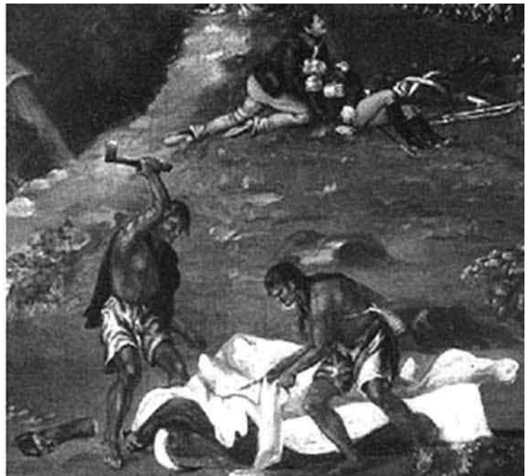
Ilustración 1: La batalla de Tacines , por José María Espinosa en: http://190.26.211.126/inbox/obj_con/1/ALTA/1_5769_1.jpg dominio del sitio en internet oficial del Museo Nacional de Colombia.

Tras la gesta de la Independencia, el arte, un monopolio de las élites, cae en un periodo de aburguesamiento, se dedica a retratar escenas costumbristas con la ligereza de una pretendida sofisticación de los modos de la clase adinerada europea; luego encuentra una potencial oportunidad de cambio con la llegada de la estética del muralismo mexicano, pero esta corriente, sin tener un hecho inspirativo trascendental (tal como lo fue en México la Revolución mexicana o la fundación de un nacionalismo a partir de la resistencia, y pese a la derrota o el carácter pírrico de las victorias , en contra de grandes potencias como Francia o