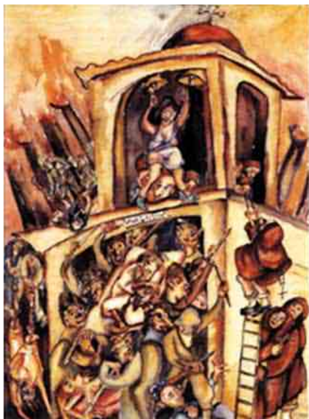
Ilustración 2. Masacre del 9 de Abril , por Débora Arango en: http://www.eltiempo.com/Multimedia/galeria_fotos/eventos-sociales-colombia/GALERIAFOTOS-WEB-PLANTILLA_GALERIA_FOTOS-11671702.html

Pero como decíamos al principio, el arte en Colombia se encontraba agolpado en dos polos: uno que podríamos llamar arte para el público , y el otro el pretendido por la burguesía, un arte eminentemente estético al mejor estilo de los modos del ambiente artístico de las galerías de las grandes metrópolis. Dichos polos se encontraban en constante tensión por la cuestión de la representación, por la discusión trabada en torno al país que se tenía y aquél que se quería retratar. El debate que enfrentaba un arte que denuncia la violencia, y otro