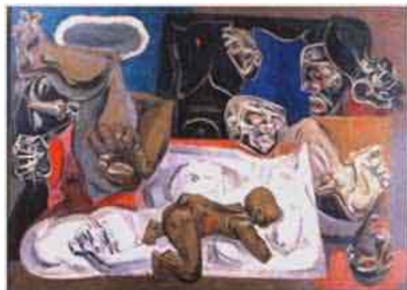
Ilustración 3. Masacre del 10 de abril de Alejandro Obregón