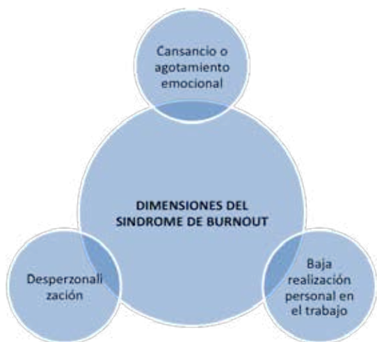
Figura 1. Dimensiones del síndrome de Burnout

El BO se manifiesta al principio a través de un aparente cansancio físico, un bajo estado de ánimo, alteraciones del sueño y del apetito, señales que pasan desapercibidas por el estrés de la vida actual, sin embargo, con el paso del tiempo, se suman otros síntomas como la depresión, la irritabilidad, el cansancio emocional, para, finalmente, llegar al estado de frustración y sentimientos de culpa por los bajos desempeños, que reflejados en el ámbito escolar se traducen en licencias prolongadas por disfonías, problemas musculares, hipoacusias temporales, depresiones leves, etc., los cuales, si no son tratados de manera integral, terminan en traslados por salud laboral, poca asertividad con estudiantes y compañeros, agresividad, temor a los espacios cerrados (aulas) y, en situaciones extremas, el abandono total de las actividades que implican relacionarse socialmente.