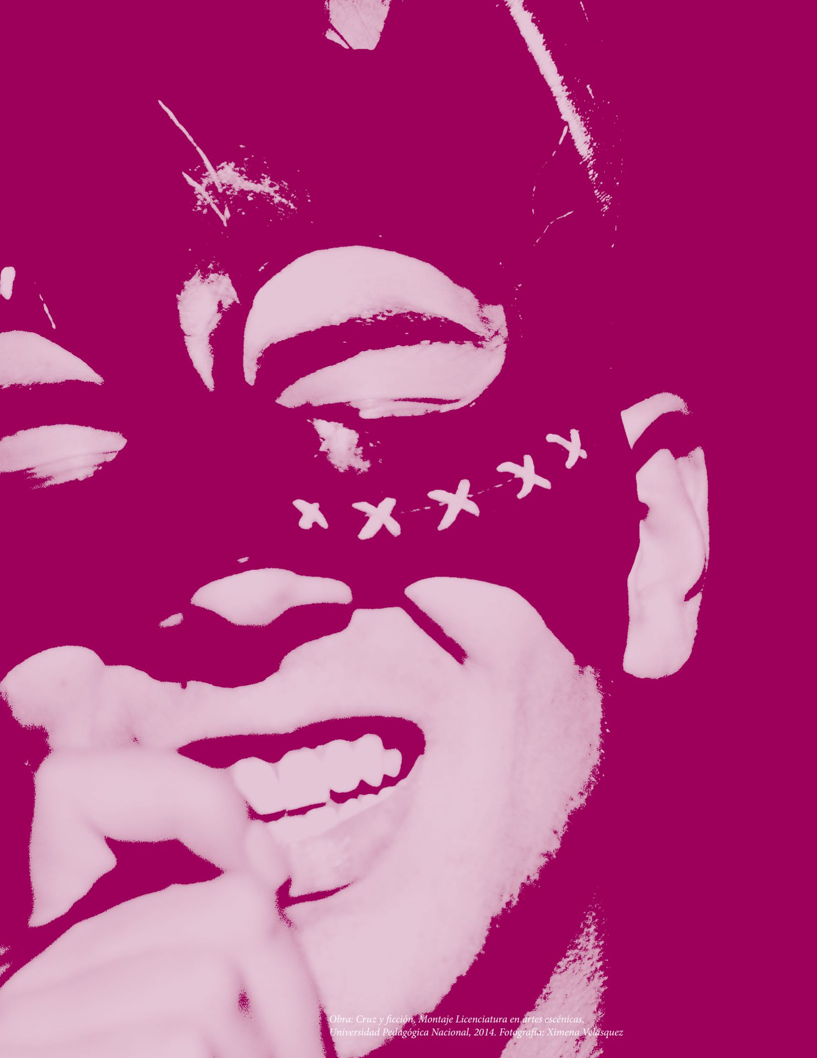
Obra: Cruz y ficción, Montaje Licenciatura en artes escénicas, Universidad Pedagógica Nacional, 2014.