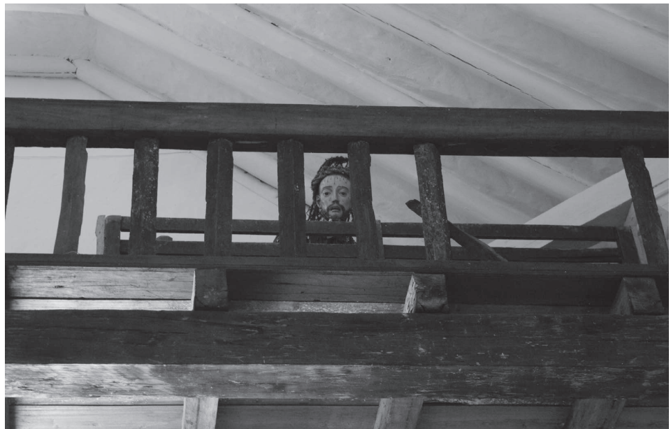
EL ESCONDITE TÓPAGA – BOYACÁ FOTOGRAFÍA DIGITAL 2009