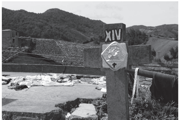
DESPOJO DE VESTIDURAS EL SANTUARIO - ANTIOQUIA FOTOGRAFÍA DIGITAL 2009