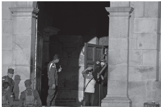
LA CAPTURA MONGUÍ – BOYACÁ FOTOGRAFÍA DIGITAL 2008