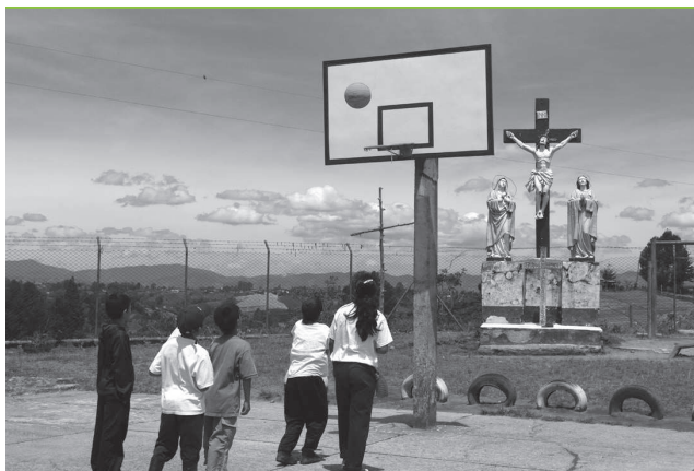
LA BARRA SANTA EL SANTUARIO - ANTIOQUIA FOTOGRAFÍA DIGITAL 2009