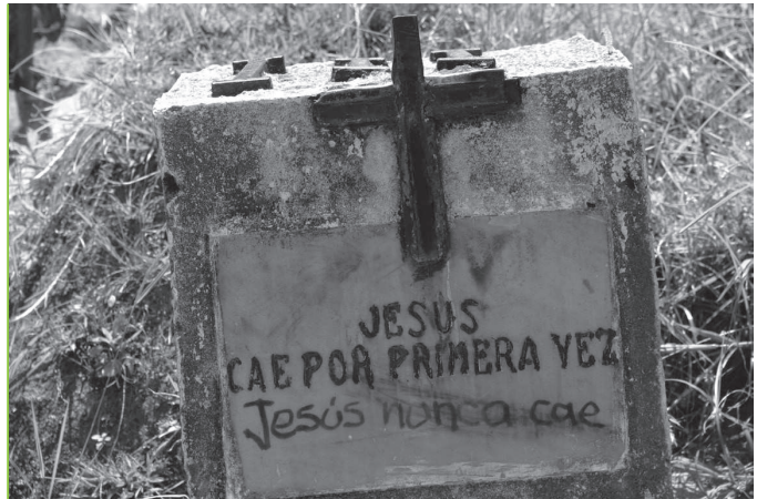
CORRECCIÓN SALENTO – QUINDIO FOTOGRAFÍA DIGITAL 2009