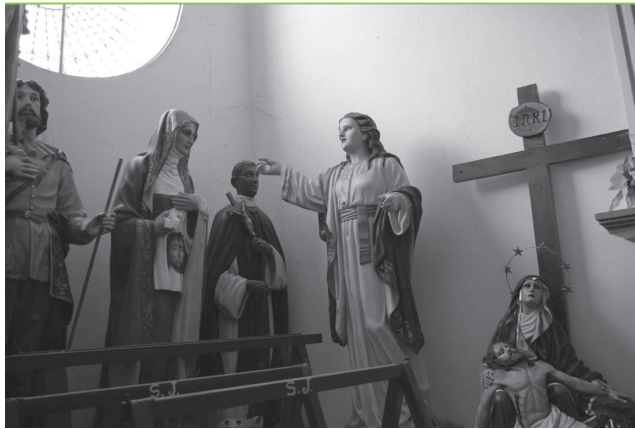
LA ACUSACIÓN CAPITANEJO – NORTE DE SANTANDER FOTOGRAFÍA DIGITAL 2009