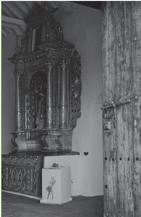
LAVADERO DE CULPAS TÓPAGA – BOYACÁ FOTOGRAFÍA DIGITAL 2008